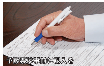
予診票は事前に記入を