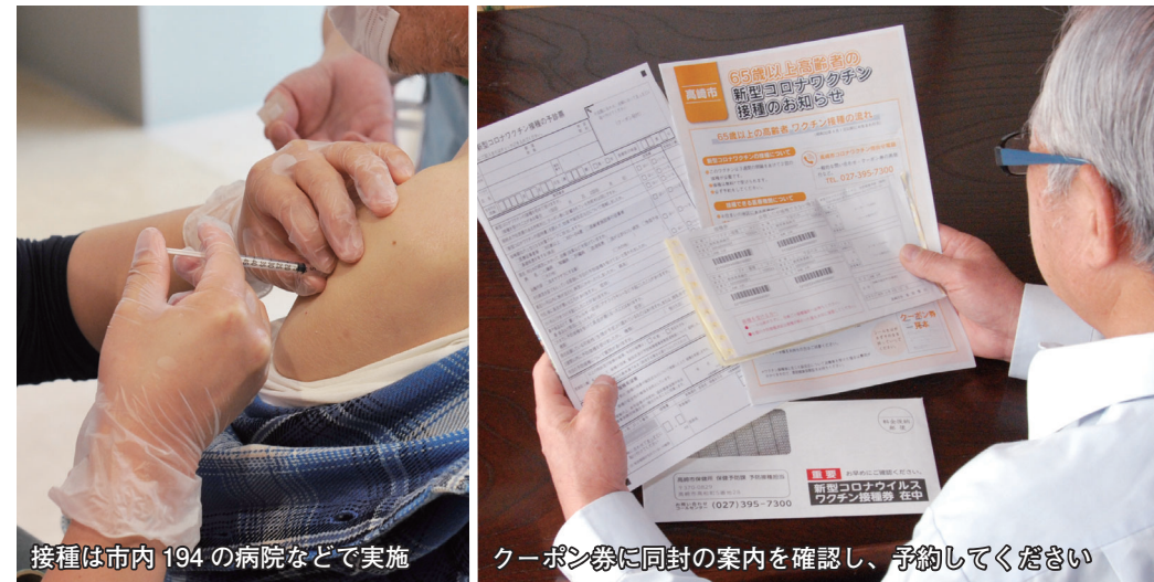
接種は市内194の病院などで実施