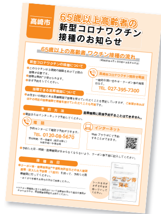
接種できる医療機関を送付した案内で確認