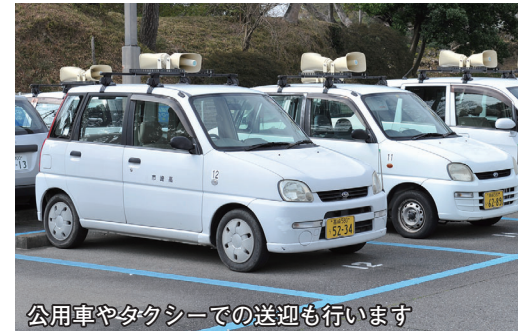
公用車やタクシーでの送迎も行います