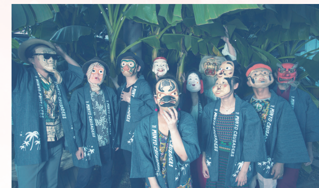
民謡クルセイダース