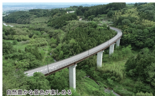
自然豊かな景色が楽しめる