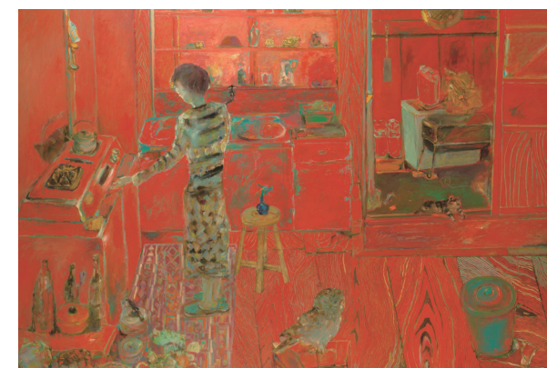
松本忠義〈台所風景〉2006年頃

アーティストたちの生み出す作品には、食卓の風景や大切にしていた本など、それぞれが積み重