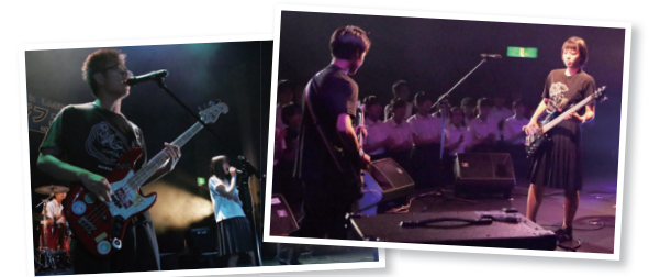
青春の1ページを仲間とともに

市は、8月15日(日)に新町文化ホールで開催する 「高校生バンドフェスティバル」の出演者を募集し ます。 ●対象=高校生のアマチュアバンド ●申し込み =7月7日(水)までに、市ホームページ(下記)から申 込書をダウンロードして記入し、オリジナル曲(コ ピー曲も可)1曲を録音したCDか録画したDVD と、メンバー全員が写った写真1枚 を同封し、〒370-1301 新町3190-1 新町文化ホール(☎0274-42-9133)へ