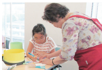
どんなふうに関くかな

●日時 8月3日(火)・4日 (水)、午後1時30分～3時 30分、計2回 ●内容=牛 乳パックを使って、仕掛け 絵本を作る ●対象=市内 の小学生とその保護者で、2 日間とも参加できる人 ●定員=6組