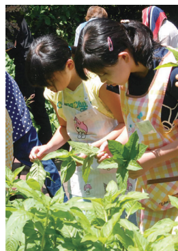
染料の摘み採りから