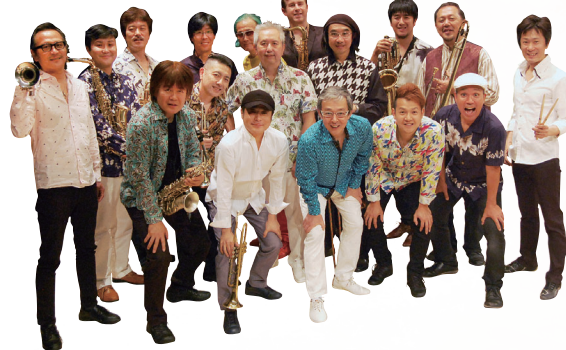
熱帯 JAZZ 楽団