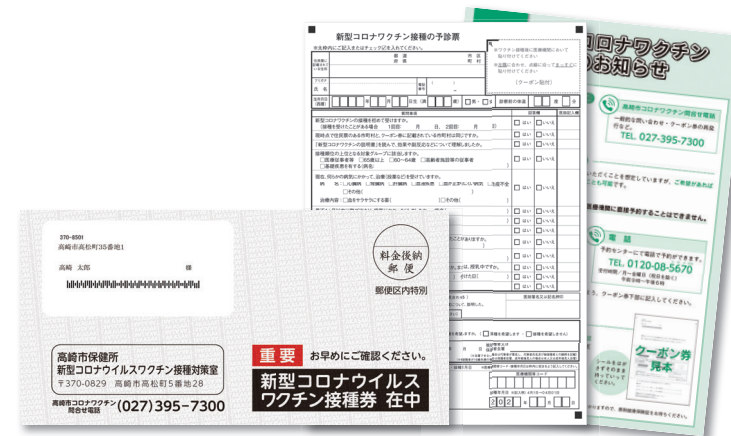
クーポン券と一緒に予診票と案内を発送

市は、新型コロナウイルスのワクチン接種について、予約の受け付けと接種を年齢で区切って順次進めています。12～64歳の人を対象に、クーポン券(接種券)を発送します。基礎疾患のある人と60～64歳の人の予約と接種、土・日曜日、祝日の集団接種を開始します。今月号では、ワクチン接種の日程や集団接種の会場などについてお知らせします。問い合わせは、高崎市新型コロナウイルスワクチン問合せ電話(☎395-7300)へ。