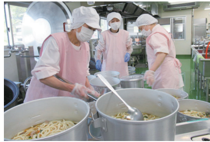
おいしい給食で健康と笑顔を

市教育委員会は、9月1日から市内の小中学校や幼稚園、学校給食センターで働く嘱託の給食技士を募集します。