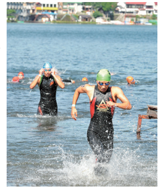
肉体の限界に挑む

7月18日(日)に開催する「第9回榛名湖リゾート・トリアスロンin群馬」の参加者を募集しています。トリアスロンは、水泳・自転車・ランニングを続けて行うスポーツです。種目は、総距離50キロを超えるもの、小中学生や初心者向けのもの、3人1組で行うリレーがあります。新型コロナウイルスの感染拡大防止の対策を徹底して行います。