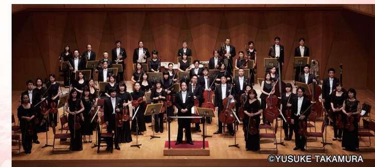
トウキョウ・ミタカ・フィルハーモニア