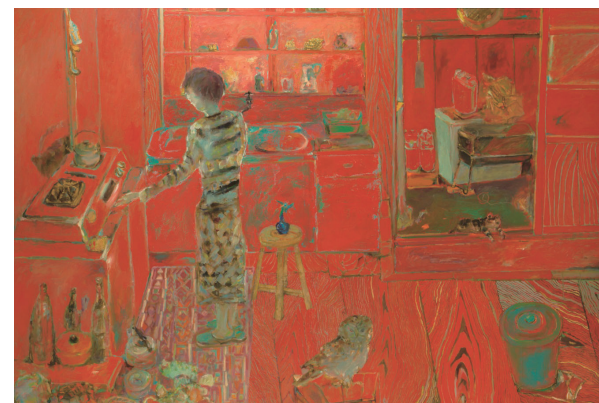
松本忠義〈台所風景〉2006年頃

アーティストたちの生み出す作品には、食卓の風景や大切にしていた本など、それぞれが積み重