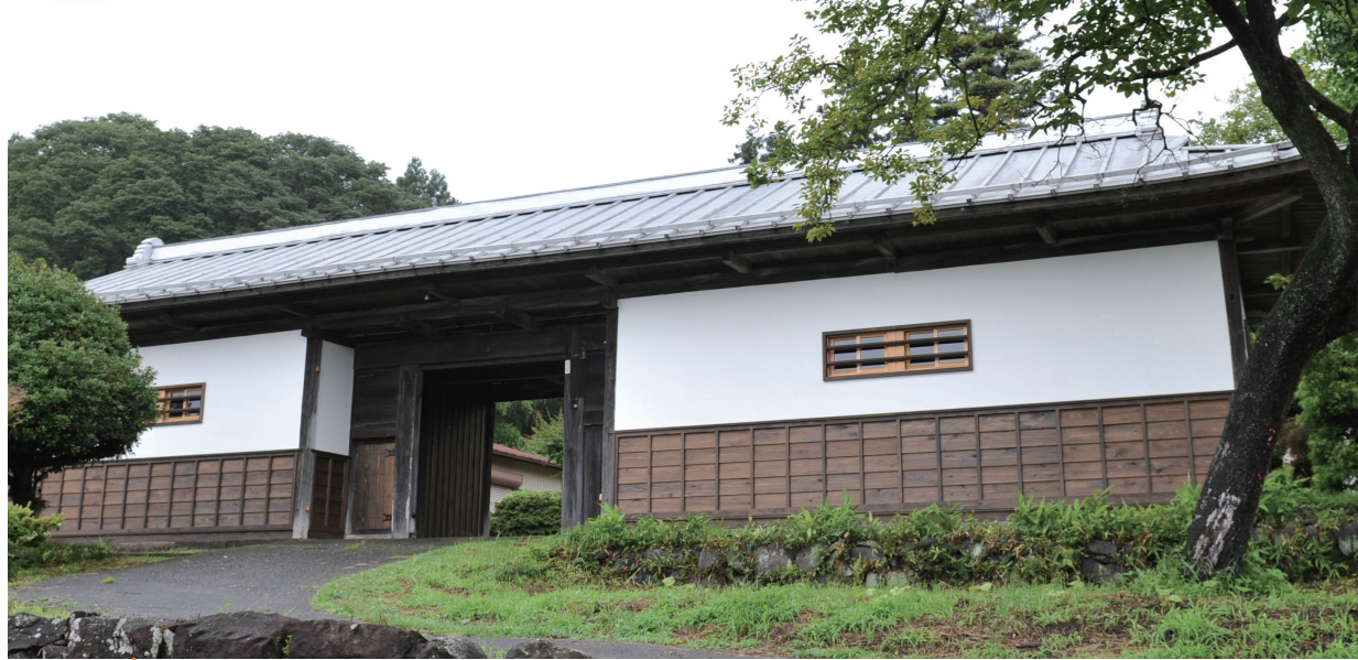
門扉の両側が部屋になっている門・長屋門。何代にもわたり大切に受け継がれてきた