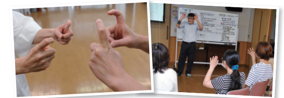
一つ一つの動きを確認

市は、手や表情などを使って伝える言葉・手話の講座を開催します。自己紹介やあいさつなどの簡単な日常会話を身に付けます。