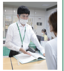
学生生活をサポート

公立大学法人高崎経済大学は、来年4月採用の事務職員の採用試験を行います。試験案内は、市役所1階総合案内と高崎経済大学総務グループで配布しています。郵送で請求する場合は、受験者本人の住所・氏名を書いた返信用封筒(角2程度)に140円切手を貼って同封し、〒370-0801上並榎町1300 高崎経済大学総務グループ(☎343-5416)へ。同大学のホームページからダウンロードもできます。 ●試験日 = 9月19日(日) ●採用予定人数 = 2人 ●申込期間 = 8月6日(金)~13日(金) ●その他 = 受験資格など詳しくは、試験案内か同大学のホームページで確認してください