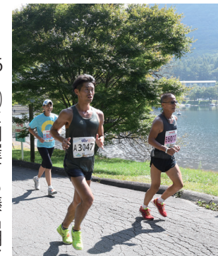
標高日本一の公認コース

9月26日(日)に開催する榛名湖マラソンの参加者を募集します。コースは、日本陸上競技連盟公認。榛名湖畔の美しい自然の中を走るフルマラソンです。新型コロナウイルスの感染拡大防止の対策を徹底して行います。 問い合わせは、榛名支所地域振興課(☎374・6715)へ。 ●コースⅡ1周約7・8キロの榛名湖畔を5周半(制限時間6時間) ●対象Ⅱ平成15年4月1日以前に生まれた人 ●部門 男子Ⅱ29歳以下、30歳代、40歳代、50歳代、60歳以上 女子Ⅱ39歳以下、40歳以上 ●定員Ⅱ先着2000人 ●費用Ⅱ6000円 ●表彰Ⅱ各部門の1～8位 ●申し込みⅡ7月16日(金)～8月2日(月)に、申し込み専用ページ(https://runnet.jp)から応募