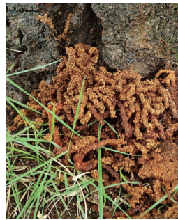
かりんとう状のフラス

成虫や、幼虫のフンと木くずが混ざったフラスと呼ばれる塊を見つけたら、写真を撮ってから環境政策課へ連絡してください。成虫は、靴で踏みつぶすなど、その場で駆除してください。