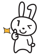
マイナンバーPRキャラクター マイナちゃん

マイナンバーカードと電子決済を利用した国のお得なポイント制度・マイナポイント。市は、マイナポイントの手続きを支援する窓口を市役所1階と各支所に、出張支援窓口をイオンモール高崎(棟高町)の1階に開設しています。