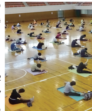
運動を続けるコツも紹介

いずれも会場は、浜川体育館(健康操は市武道館)で、対象は市内に在住か通勤、在学の18歳以上の人で、申し込みは、7月31日(土)までに、往復はがきに住所・氏名・年齢・電話番号・教室名(コース名)を書いて、〒370-0081浜川町1487浜川体育館(☎344-1551)へ。教室ごとに1人1枚の応募で、定員を超えたときは抽選します。