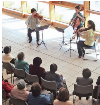
プロの演奏を気軽に楽しむ

群馬交響楽団は、団員による無料の出張コンサート「心に響く音楽会」を開催する団体を募集します。