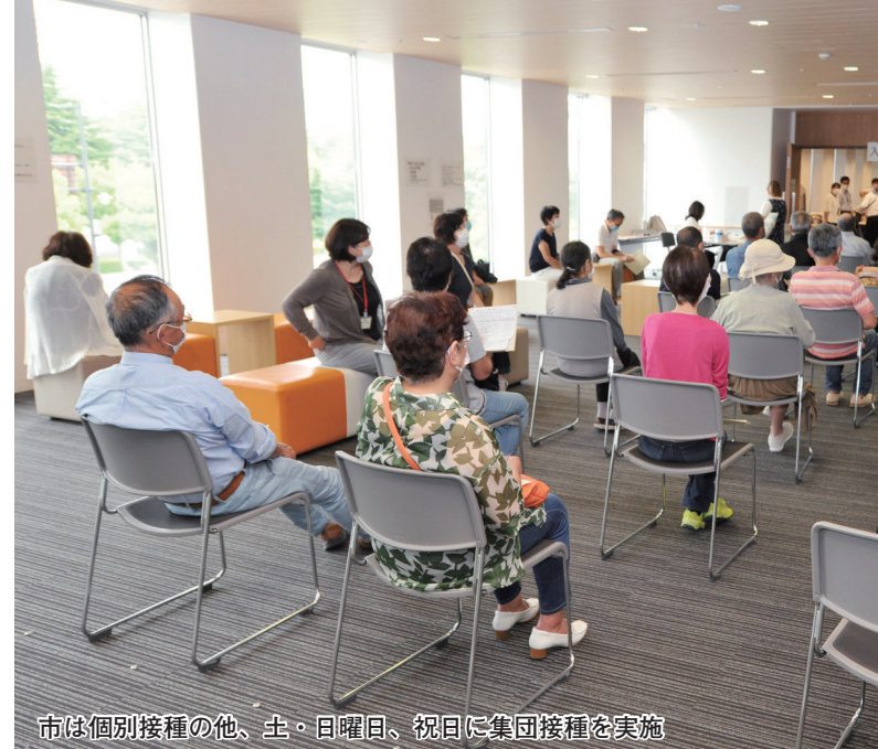
市は個別接種の他、土・日曜日、祝日に集団接種を実施