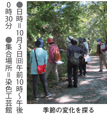
季節の変化を探る