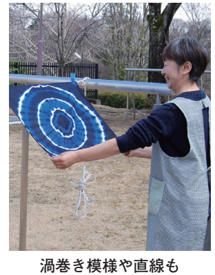
渦巻き模様や直線も

●日時 ☎10月3日(日)午前10時～午後0時30分 ●集合場所 ☎染色工芸館 ●期日 ①草木染 ☎9月5日(日)・15日(水)・19日(日)・23日(祝) ②藍染 ☎12日(日)・20日(祝)・26日(日) ●時間 ☎午前10時～正午 ●内容 ☎1人1点の染色体験 ●定員 ☎各回先着8人 ●費用 ☎①ポケットチーフ600円、スカート1200円②ハンカチ600円、バンダナ1000円 ●申し込み ☎電話で染料植物園へ