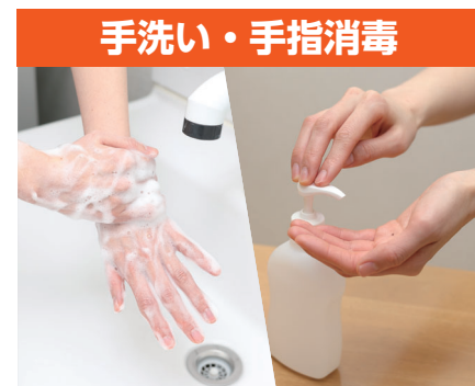
手洗い・手指消毒

引き続き感染予防を徹底してください。下記の基本的な対策を行うなど、皆さん一人一人のご協力をお願いします。