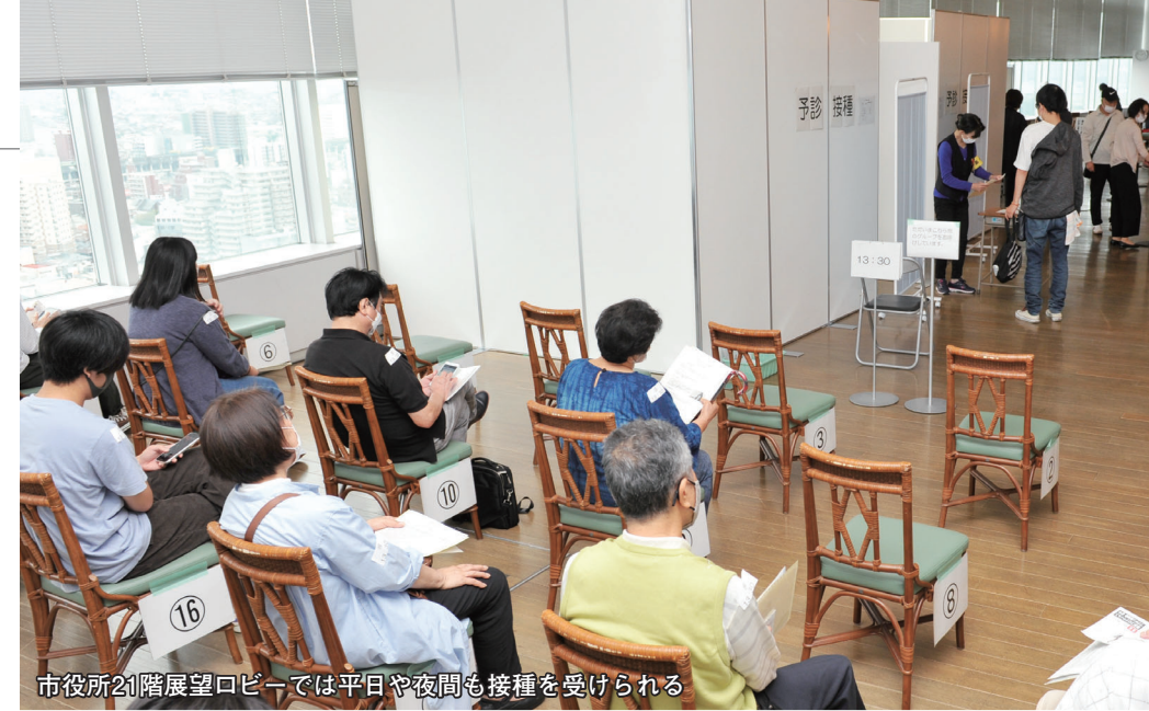
市役所21階展望ロビーでは平日や夜間も接種を受けられる