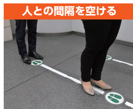
人との間隔を空ける

洗い残しのないように、しっかり手を洗う。外出先などで手洗いができないときは、手指消毒液を使う