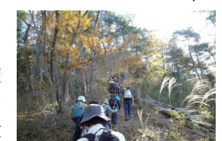
秋を感じてリフレッシュ

吉井観光協会は、秋の牛伏山を巡るハイキングを開催します。牛伏ドリームセンターで昼食や入浴も楽しめます。コースは、ゆるやかな車道を歩くコースと、竹林や尾根などの登山道を歩くコースのどちらかを選べます。持ってくる物など詳しくは、市ホームページで確認してください。 ●日時＝11月17日(木)午前8時45分集合 ●集合場所＝牛伏ドリームセンター ●対象＝市内に在住か通勤、在学の小学生以上で、5km程度歩ける人 ●定員＝50人(抽選) ●費用＝300円(保険料・入浴代込み、昼食代は別途) ●申し込み＝11月2日(木)までに、はがきに参加者全員の住所・氏名・年齢・電話番号・希望のコースを書いて、〒370-2192 吉井支所 産業課(☎027-387-3134)へ