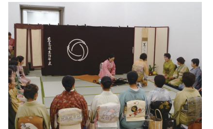
茶道に触れるきっかけに

市と高崎茶道会の合同茶会を開催します。高崎茶道会所属の6流派が一堂に会し、本格的なお点前を披露。初心者でも気軽に茶道の体験ができる、市民参加特別席もあります。