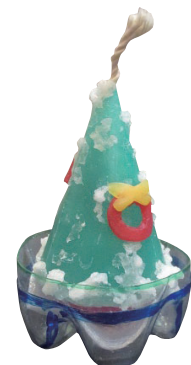
クリスマスに向けて

クリスマスキャンドルを作ろう ●期日と対象 ①11月17日 市内に在住か在勤のおおむね60歳以上の人 ②26日(日) 市内に在住か在学の小・中学生(小学3年生以下は保護者同伴) ●会場 創作室 ●内容 ろうを溶かしてカラフルなキャンドルを作る ●定員 18人 ●費用 500円 ●締め切り日 ①11月3日 ②10日(木) ●期日 11月17日(木) ●会場 パソコン室 ●内容 プログラミング言語「スクラッチ」を使ったプログラミング体験 ●対象 市内に在住か在勤のおおむね60歳以上の人 ●定員 6人 ●費用 無料 ●締め切り日 11月3日(祝) クリスマスに向けて