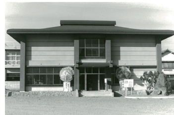
開館当時の吉井郷土資料館

吉井地域の歴史や民俗に関する資料を数多く展示・所蔵する吉井郷土資料館。昭和47年の開館以来、さまざまな企画展や講座などをとおして、郷土学習に貢献してきました。