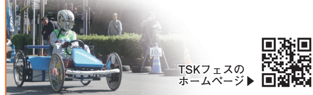
TSKフェスのホームページ

県営住宅の入居者 ●期間 11月1日(火)~15日(火) ●入居資格 住宅に困窮している人 ●募集案内 市役所9階県営住宅供給公社高崎支所各支所建設課(倉淵支所は農林建設課)で配布 ●その他 募集する住宅の所在地や家賃、申し込み方法などは、募集案内で確認してください ●問い合わせ先 県住宅供給公社(☎027・2223・5811) 高崎産業技術専門校の入校生 県立高崎産業技術専門校は、来年度の入校生を募集します。試験内容