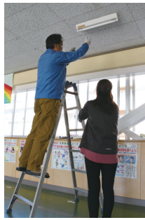
校内の環境を整える

●募集人数 = 10人程度 ●勤務時間と内容 1日5時間 = 来客・電話対応、事務補助など 1日6時間 = 樹木の手入れや除草、設備の維持・管理など ●時給 = 895円 ●その他 = 6時間勤務の場合は社会保険に加入 ●申し込み = 11月30日(水)までに、市役所15階教育総務課 (☎027-321-1291) へ