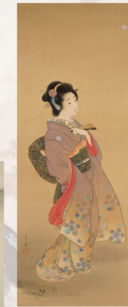
上村松園〈春の野図〉1910年頃