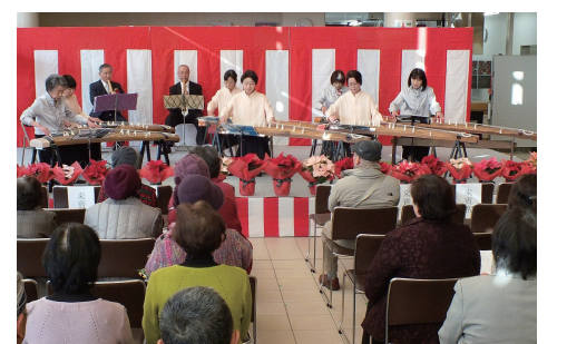
室内でゆっくり音楽を楽しむ

榛名福祉会館で、はるなまちなか音楽祭と軽トラック市を同時開催。さまざまなジャンルの音楽をお楽しみください。