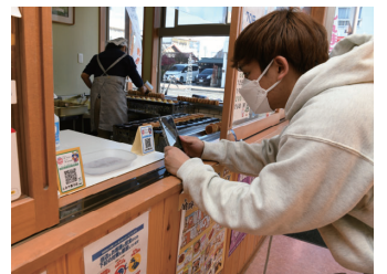
2次元コードを読み込んでスタンプをゲット

新町は2km四方の大きさの、歩いて巡ることができる町です。新町商工会は、食で新町の魅力を見つけられるイベントを開催中です。スマートフォンを使ったスタンプラリー形式で、期間は来年1月30日(月)まで。スタンプは、町内24か所の飲食店などに設置されています。スタンプを集めると商品券が当たる抽選に参加できます。LINEを使ってポイントを貯めると、クーポンがもらえるイベントも同時開催中。詳しくは、同イベントのホームページ(右記)で確認してください。問い合わせは、同商工会(☎0274-42-0930)へ。