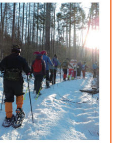
景色を楽しみながら

いずれも、申し込みは電話ではまゆう山荘(倉洲町川浦 ☎027-378-2333)へ。 津軽三味線の演奏会 ●日時=来年1月15日(日)午前11時30分集合 ●集合場所=はまゆう山荘 ●内容=津軽三味線の生演奏と昼食、温泉入浴 ●定員=先着50人 ●費用=3,300円(昼食代、入浴代込み) ●その他=当日はJR高崎駅東口から無料の送迎バスを運行(午前10時30分出発) スノーシュー体験 ●期日=来年1月28日(土)・29日(日)、1泊2日 ●集合場所=JR高崎駅東口(28日午後1時。マイクロバスで送迎) ●内容=雪の上を楽に歩けるスノーシューを履いて、はまゆう山荘周辺の森や浅間牧場などを歩く(スノーシューは貸し出しします) ●定員=先着8人 ●費用=1万3,000円(食事代、保険料、はまゆう山荘の宿泊費込み) ●持ってくる物=防寒具、防水の靴(長靴不可)