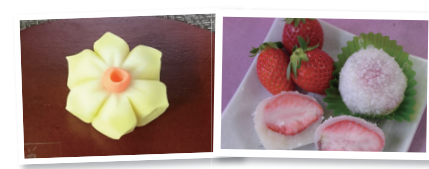
黄色スイセンとイチゴ道明寺餅を作る

勤労青少年ホームは、和菓子作りを体験する講座を開催します。春をテーマにした和菓子