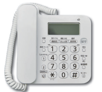
詐欺被害に遭わないために

の滞納がない ●対象となる機器=次の①～④の全てに当てはまる物 ①「通話が録音されます」などの警告メッセージが自動で流れる ②通話内容が自動で録音される ③令和2年4月1日以降に新品で購入した ④自宅に設置した ●必要な物=領収書、カタログや取扱説明書など購入した機器の機能が確認できる物、申請者の口座の分かる通帳のコピー、本人確認のできる物、代理人が申請する場合は委任状