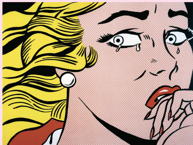
© Estate of Roy Lichtenstein, New York & JASPAR, Tokyo, 2022 G3053