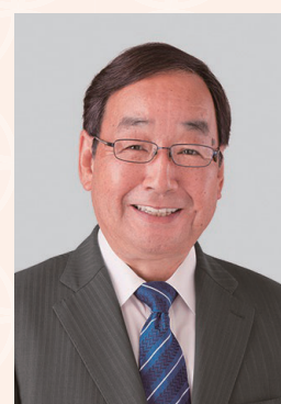
高崎市長 富岡 賢治