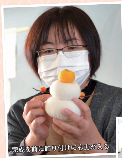
完成を前に飾り付けにも力が入る