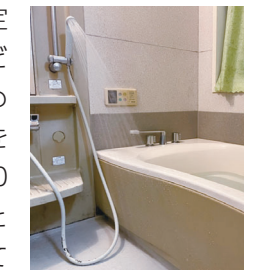
シャワーで床も暖める

入浴時のヒートショックを予防するポイント ●湯船の温度は41℃以下に設定する ●暖房器具やシャワーなどを活用し、脱衣所と浴室を暖める ●食事や飲酒の直後の入浴を避ける ●湯に漬かる時間は10分以内にする ●浴槽から出るときは、手すりや浴槽の縁を持ってゆっくり立ち上がる