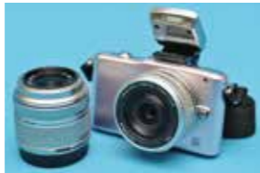
ミラーレスカメラとレンズ

市は、市税の滞納処分として差し押さえた財産を、紀尾井町戦略研究所株式会社が運営するインターネットオークションを利用して公売します。おもちゃやアクセサリなど、下表以外にも出品物があります。出