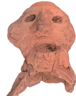
本市で出土した人形土器

本市と前橋市は、両市が保有する文化財を紹介する企画展「東国千年の都」を開催します。今回は、令和元年以降の発掘調査とその成果を中