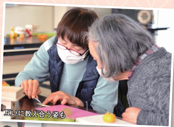
互いに教え合う姿も