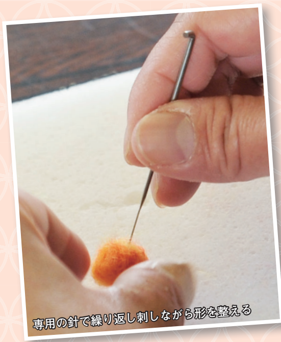
専用の針で繰り返し刺しながら形を整える