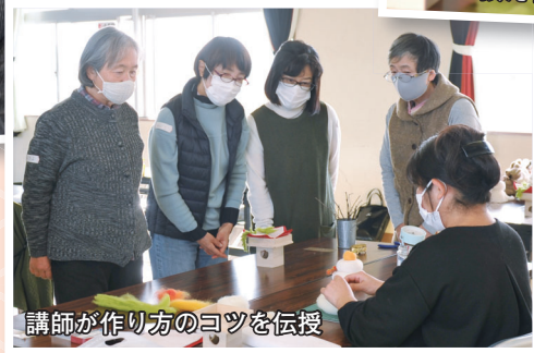
講師が作り方のコツを伝授