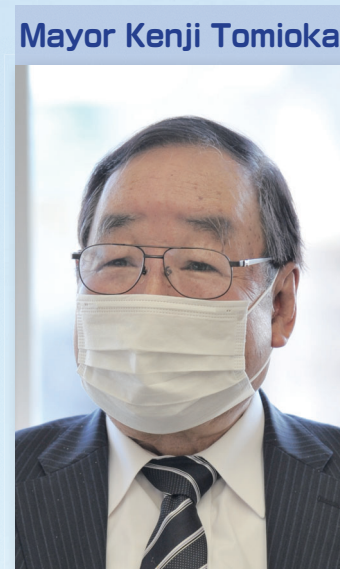
Mayor Kenji Tomioka

日高病院の看護師。副看護部長。感染症に関する専門的な知識と技術のある、感染管理認定看護師の資格を持つ。早くから陽性患者を受け入れ、感染病棟で現場の指揮を執っている