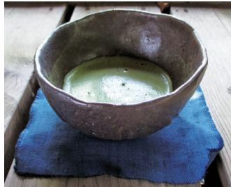
自作の茶わんでお茶を楽しむ

染料植物園は、灰からできた釉を使う茶わん作りと、コースターの藍染を行う講習会を開催します。