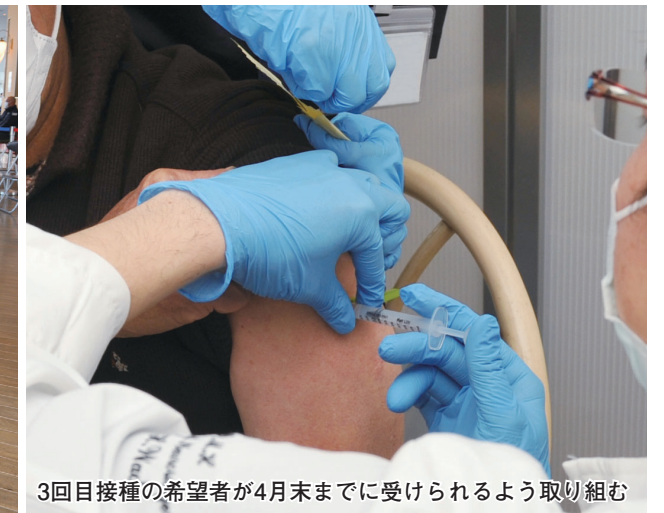
3回目接種の希望者が4月末までに受けられるよう取り組む