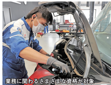
業務に関わるさまざまな資格が対象