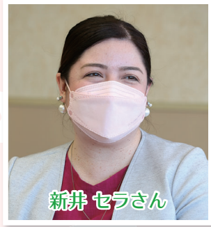
3歳の保育園児のママ。夫婦ともフルタイムで勤務している。子育てSOSサービスを利用

子 育て世代のニーズに合わせて、全国でも例のない独自のサービスを展開している高崎市。今回は、電話一本でヘルパーが自宅に伺ってお手伝いする「子育てSOSサービス」と、理由を問わずに誰でも利用できる託児施設の、それぞれの利用者スタッフの皆さんをお迎えして、お話を伺います。