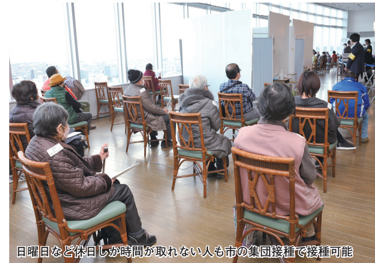
日曜日など休日しが時間が取れない人も市の集団接種で接種可能