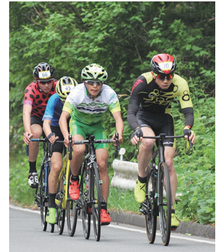
新緑の中で力試し

5月22日(日)に開催する自転車レース「第10回榛名山ヒルクライムin高崎」の参加者を募集しています。脚力に応じたコースや団体戦があり、初心者から上級者まで誰でも楽しめます。新型コロナウイルスの感染拡大防止の対策を徹底して行います。申し込みは、3月31日(木)までに、公式ホームページから行ってください。費用など詳しくは、公式ホームページにある大会要項を確認してください。