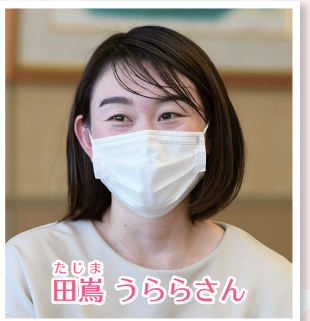
未就園児の女の子のママ。結婚を機に本市に転入。託児ルーム「けやき」を開設時から利用