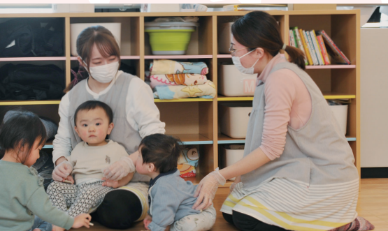
託児ルームは、まちなかの「かしの木」と群馬地域の「けやき」の2か所。公共の支援にも頼って少しのゆとりを