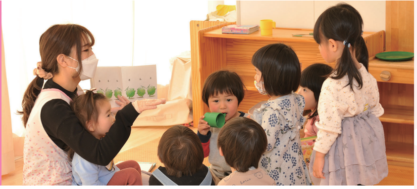
託児ルームで子どもをお預かり