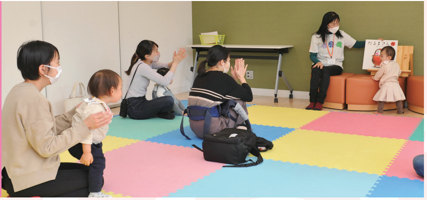
子育て支援が受けられる拠点施設

市は、子育て世代を応援するため、さまざまな取り組みを行っています。子育てSOSサービスは、ヘルパーが訪問して家事や育児をお手伝い。理由を問わずに利用できる託児ルームは2か所開設しています。また、子育てなんでもセンターでは、さまざまな支援が1か所受けられます。