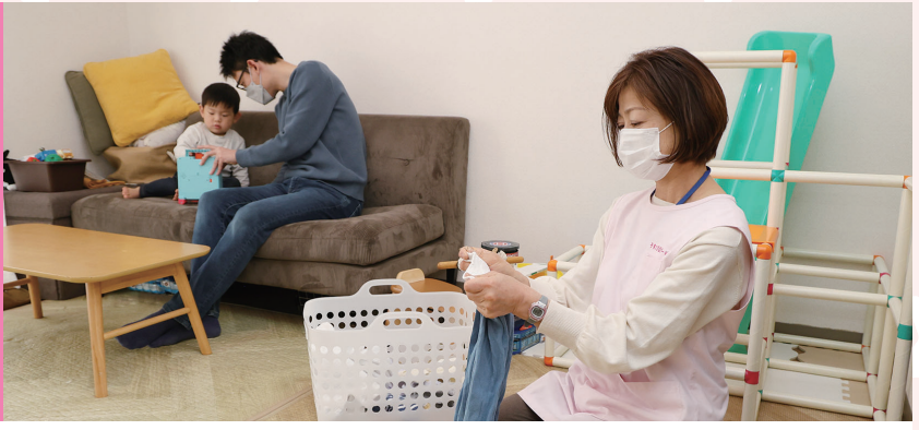
家事や育児をヘルパーがお手伝い