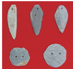
剣と鏡の石製模造品

観音塚考古資料館は、石製模造品をテーマにした企画展「古墳時代のものづくり～高崎市内の石製模造品製作遺跡」を開催します。