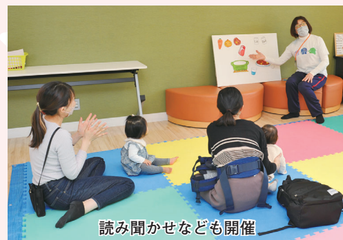
読み聞かせなども開催

妊娠期の不安や子育ての悩み、再就職の相談など、子育て世代に必要な支援が1か所で受けられます。プレイルームなどもあります。気軽にご利用ください。詳しくは、子育て応援情報サイト「ちゃいたか」で確認できます。