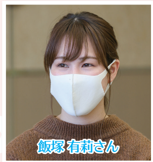
託児ルーム「けやき」の保育士として子どもたちを見守る。「かしの木」開設時からのスタッフ

飯塚 他にも、小学校の旗振り当番や銀行の手続きなど、そういうときに利用するのも良い案だと思います。