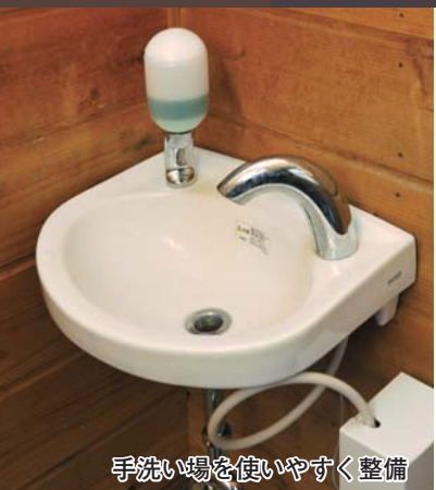
手洗い場を使いやすく整備

衛生面向上のための 飲食店の特別枠について 飲食店の衛生面の向上を支援するための特別枠も継続します。対象は、高崎食品衛生協会の食品衛生責任者講習会などを受講した人がいる飲食店。対象となる工事は、衛生向上を目的に行う、厨房や客用トイレの改修、給排水・衛生設備の入れ替えなどです。詳しくは、食品衛生責任者講習会については食品衛生協会(☎328・5481)に、特別枠については生活衛生課