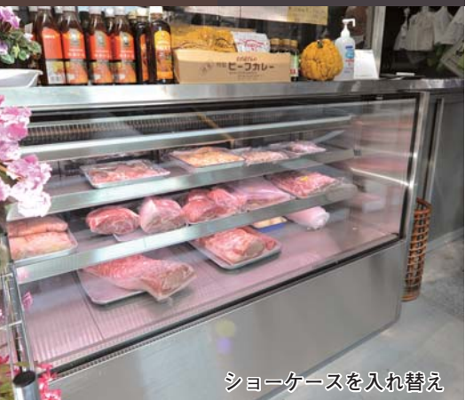
ショーケースを入れ替え

助成制度を利用して、座席やシャンプー台の間に、飛沫防止用の仕切りカーテンを設置しました。それまでは手作りのビニールカーテンをかけていたんです。簡易的で見栄えも良くないので、何とかしたいと思っていたとき、新型コロナ対策も助成の対象になると知りました。店の雰囲気に合うしっかりした物が付けられて良かったです。シャンプー台も1台、フラットにできて足腰の負担の少ない物に取り替えました。個人店にとって金額の大きい物なので、助成があって本当に助かりました。コロナ禍でも改めて頑張ろうという気持ちになりました。