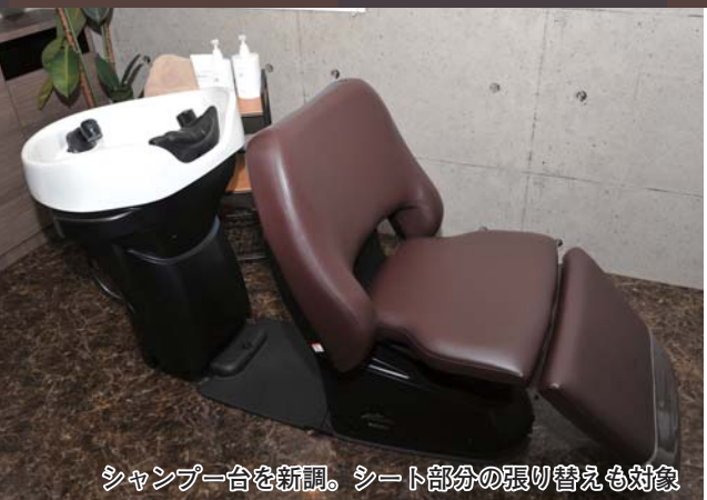
シャンプー台を新調。シート部分の張り替えも対象