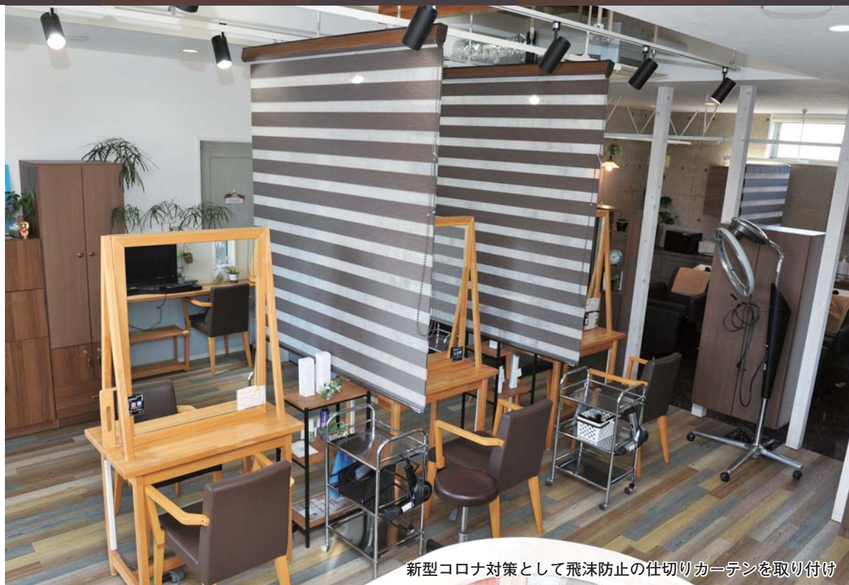
新型コロナ対策として飛沫防止の仕切りカーテンを取り付け