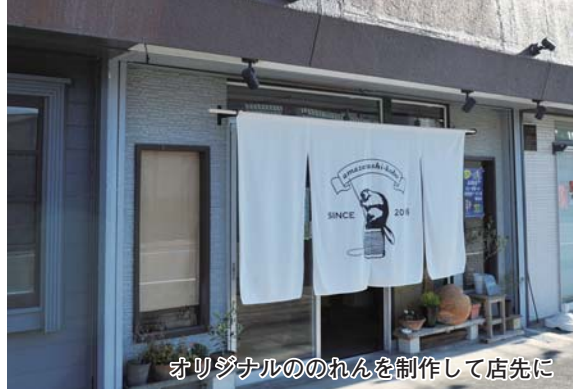
オリジナルののれんを制作して店先に