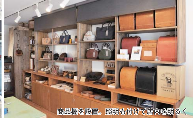
商品棚を設置。照明も付けて店内を明るく

市は、店舗の改装や備品の購入に最大100万円を助成する「まちなか商店リニューアル助成事業」を、来年度も実施する予定です(3月議会承認後)。来年度は、助成を利用できる回数や申請方法が変わります。飲食店向けの衛生面向上のための特別枠は継続。新型コロナウイルスの感染防止対策も、引き続き対象となります。今回号では、助成の概要や来年度の変更点などについてお知らせします。