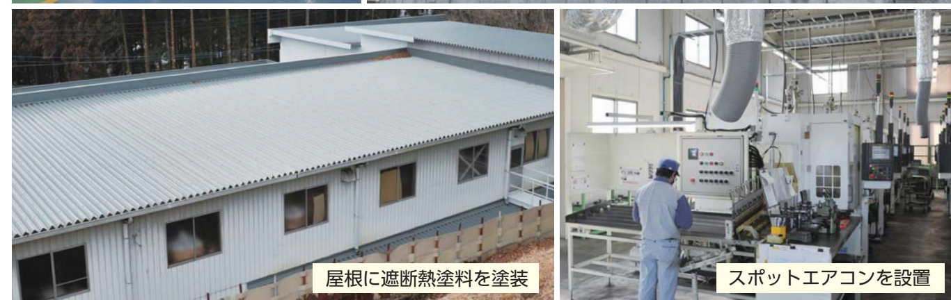
屋根に遮断熱塗料を塗装