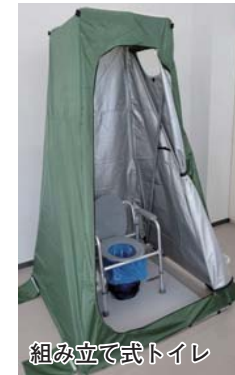
組み立て式トイレ