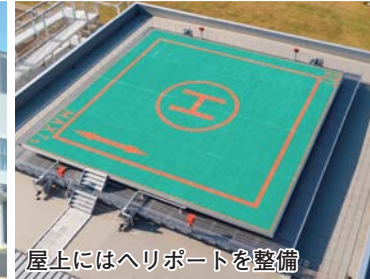
屋上にはヘリポートを整備