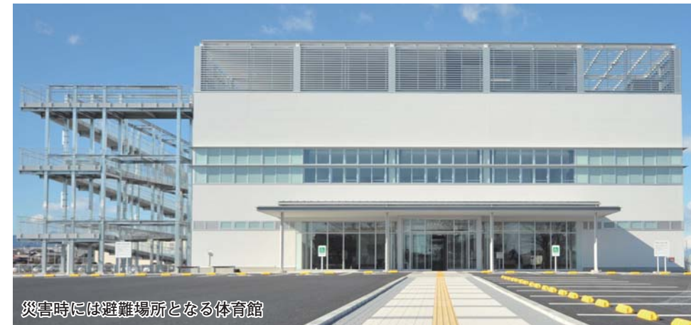
災害時には避難場所となる体育館

新町地域の新たな体育館「新町防災アリーナ」が4月1日(金)に開館します。今回号では、同アリーナの概要などについてお知らせします。問い合わせは、スポーツ課（☎321-1296）へ。