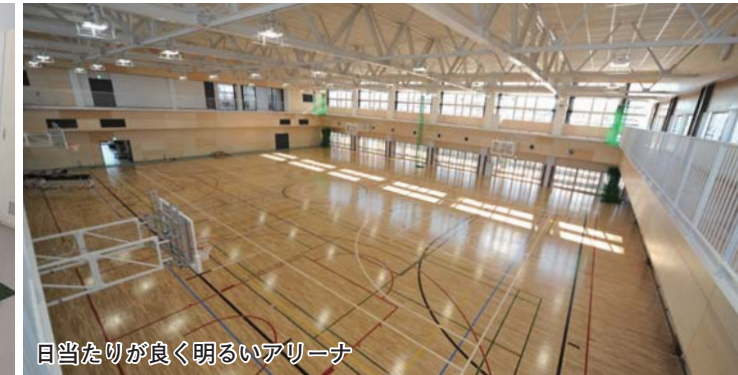
日当たりが良く明るいアリーナ