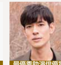
最優秀助演俳優賞 「いとみち」 「偶然と想像」 中島歩