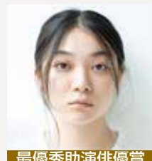
最優秀助演俳優賞 「ドライブ・マイ・カー」 三浦透子