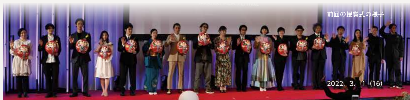
前回の授賞式の様子

●日時=3月25日(金)午後1時40分上映開始 ●会場=シネマテークたかさき ●問い合わせ先=高崎映画祭事務局