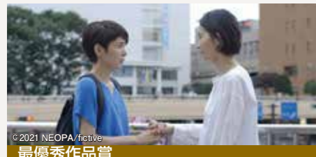
最優秀作品賞 「偶然と想像」 濱口竜介監督