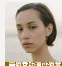
最優秀助演俳優賞 「あのこは貴族」 水原希子