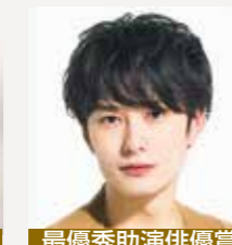
最優秀助演俳優賞 「ドライブ・マイ・カー」 岡田将生