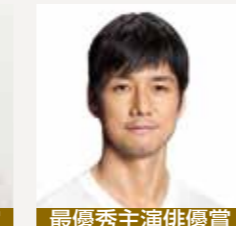
最優秀主演俳優賞 「ドライブ・マイ・カー」 西島秀俊