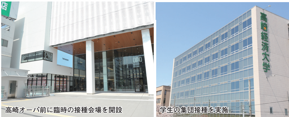
高崎オーパ前に臨時の接種会場を開設