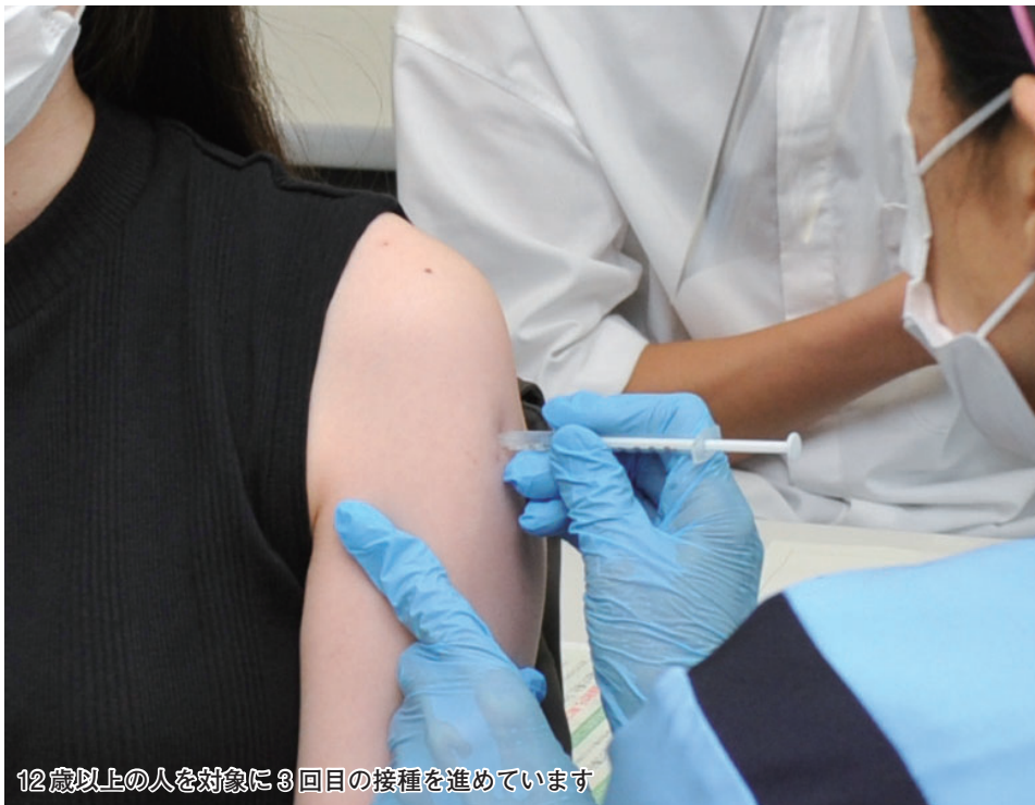
12歳以上の人を対象に3回目の接種を進めています