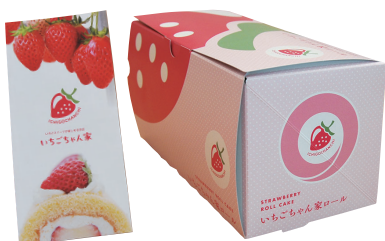
パンフレットや商品を入れる箱なども対象