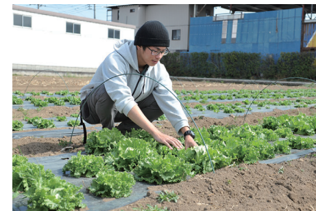
これから農業を始める人を応援

新規 新規就農者を支援 かがやけ新規就農者応援給付金 …………… 2,000万円