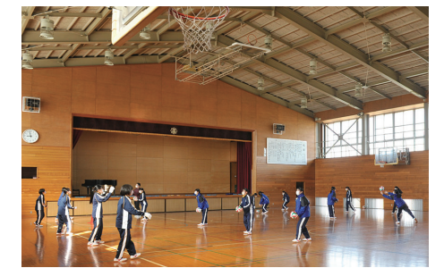
空調を整備し体育館を快適に