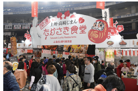
首都圏でのイベントにも参加予定