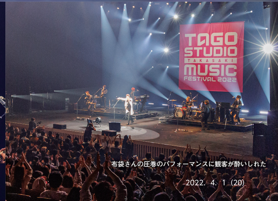
布袋さんの圧巻のパフォーマンスに観客が酔いしれた