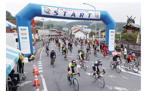
榛名山を舞台にした自転車レースを開催

新規 JR新町駅にバリアフリートイレを設置 …………… 1,000万円 ● 榛名山ヒルクライム in 高崎などの開催 …………… 3,950万円 ● 倉淵・榛名・吉井地域への移住定住者に対する支援 …………… 1億円 ● 市内全域の道路の維持・補修工事 …………… 5億1,300万円