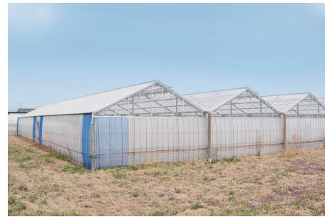
メロンを水耕栽培するビニールハウスを倉淵地域に整備予定