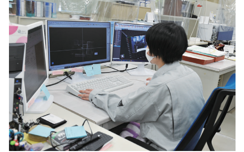
若者の市内への定着を促進