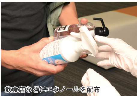
飲食店などにエタノールを配布