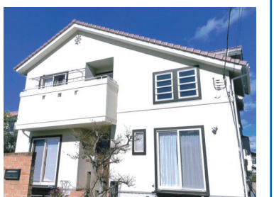
今の家をより住みやすく

市は、市民が自宅の改修や修繕を行う場合に最大20万円を助成しています。対象となる工事は、市内の業者が施工する住宅の屋根や外壁・水回り・内装な