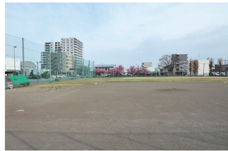
児童相談所を高崎問屋町駅から徒歩2分の場所に設置予定