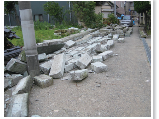
倒壊した塀が避難や救助の妨げになることも