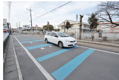
学校周辺の道路に路面段差を整備

新規 安心・安全な登校のために 通学路の緊急安全対策 …………… 2,100万円