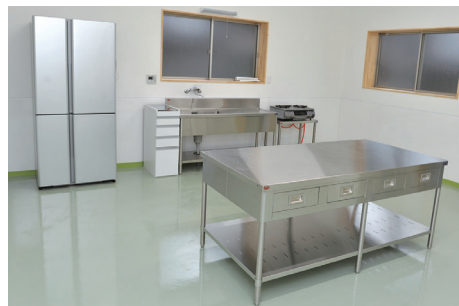
◀梅を加工する作業所を整備