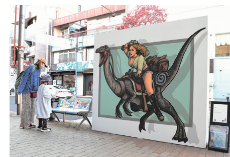
文化イベントの開催を支援