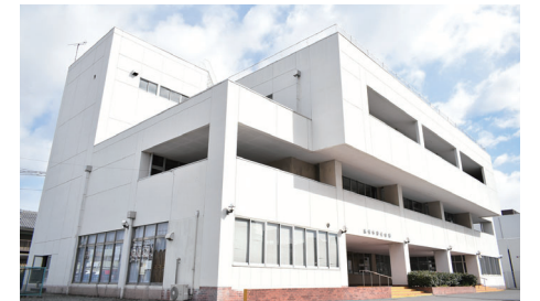
老朽化した労使会館を新しく