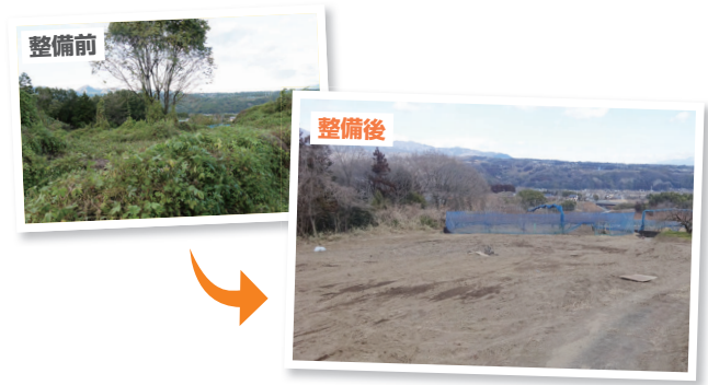
重機で木の伐採から整地までを行った果樹園

補助を受けるには、事前に農林課（☎321-1317）に相談してください。補助額などについて詳しくは、同課に問い合わせてください。