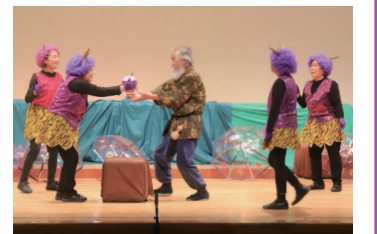
仲間と作品を作り上げる達成感を

市は、10月30日(日)に箕郷文化会館で上演する市民演劇の出演者とスタッフを募集します。演技・舞台などの経験は問いません。