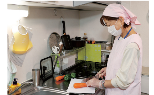
料理や掃除などの家事をヘルパーが手助け