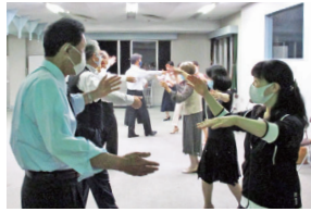
ペアならではの踊りを楽しむ