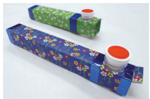
鏡と光が見せる不思議な世界 ●費用=300円 ●締め切り日=4月28日

●期日=5月14日(土) ●会場=創作室 ●内容=3枚の鏡を使い、三角形が続いて見える万華鏡を作る ●対象=市内に在住か在校の小・中学生(小学3年生以下は保護者同伴) ●定員=18人 ●締め切り日=4月28日