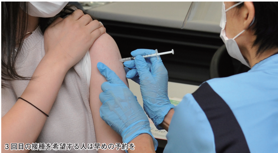
3回目の接種を希望する人は早めの予約を