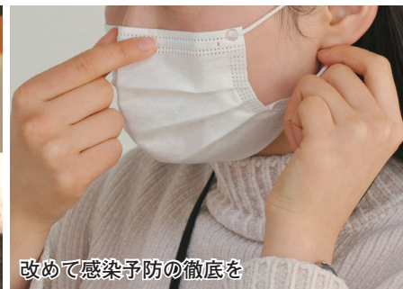
改めて感染予防の徹底を

市は、18歳以上の人を対象に、新型コロナウイルスの3回目のワクチン接種を実施しています。また、感染拡大を防ぐため、飲食店などへのエタノールの配布を継続して行っています。今回号では、3回目のワクチン接種の概要や感染拡大を防ぐ市の取り組みなどについてお知らせします。問い合わせは、高崎市コロナワクチン問合せ電話(☎ 395-7300)へ。