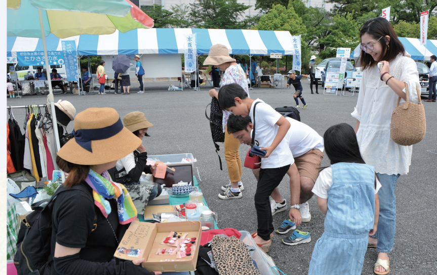
掘り出し物がいっぱいのフリーマーケット