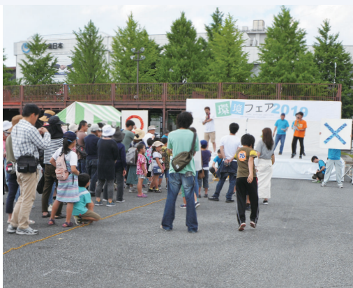
環境〇×クイズでエコを学ぶ