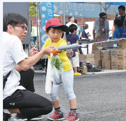
水道管で水鉄砲作り