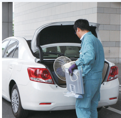
車で搬入した小型家電などを回収