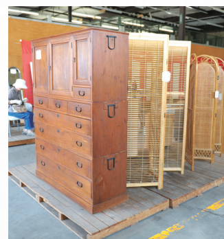
まだ使える良品が並ぶ

●日時= 6月11日(土)・12日(日)、午前9時30分～午後2時30分 ●内容= たんすや食器棚などの粗大