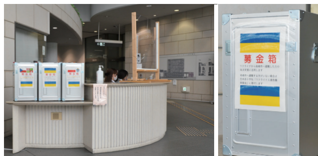
市役所は 1 階総合案内に設置

プルゼニ市とポズナン市への支援も行います。プルゼニ市は、1990 年から交流を続けている姉妹都市です。ポズナン市は、東京 2020 オリンピックで本市がホストタウンを務めたことから、スポーツや文化、産業などの分野で交流が続いています。今回、ポズナン市からの要請を受け、プルゼニ市と併せて支援を決定。集まった募金を両市に寄付します。