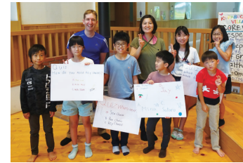
仲間と一緒に英語力を高める

市は、小中学生が生きた英語を学べる山村留学施設「くらぶち英語村」の留学生を募集します。募集するのは、夏休みに行う短期コースです。仲間と一緒に英語力を高める自然豊かな倉洲地域で、ネイティブスピーカーのスタッフと、山歩きや川遊びなどさまざまな体験をしながら、実践的な英語力を身に付けます。 ●期日＝①7月26日(火)～29日(金)、3泊4日②8月1日(月)～5日(金)、4泊5日③8月6日(土)～11日(祝)、5泊6日 ●対象＝英語を学ぶ意欲のある①小学2～4年生②③小学4年生～中学生 ●定員＝各20人(抽選) ●費用＝3～5万円 ●申し込み＝5月26日(木)までに、同村のホームページにある申込書に記入して、〒370-3405 倉洲町川浦 1414-1 くらぶち英語村 (☎384-4508) へ