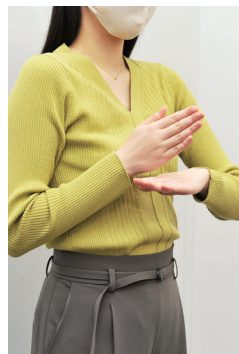
「ありがとう」の手話

いずれも定員は、各コース15人(抽選)で、費用は3,300円(テキスト代)です。