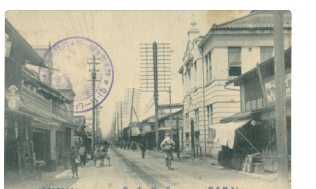
明治〜大正頃の連雀町

市歴史民俗資料館は、企画展「絵葉書になった高崎の明治・大正・昭和」を開催します。市内の名所の中には、時代が移り変わった今では見ることができなくなった風景や建物があります。そうした景色は、写真が使われた絵はがきの中に、今も見ることができます。