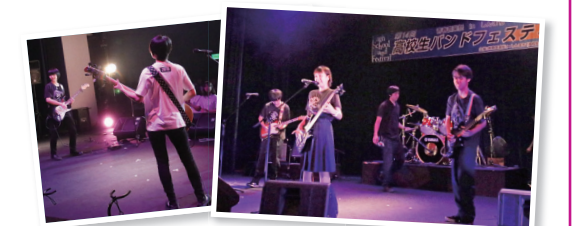
仲間と一緒に熱い演奏を