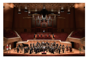
陸上自衛隊中央音楽隊

日本を代表する吹奏楽団・陸上自衛隊中央音楽隊が高崎芸術劇場に登場します。迫力の演奏をお聞き逃しなく。