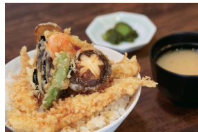
倉洲の味覚を堪能

●日時=7月10日(日)午前9時集合 ●内容=トマト農園の見学、倉洲産のニジマスやイワナなどの川魚を使った天丼の昼食、温泉入浴 ●費用=3,500円(昼食代、入浴代込み。夏野菜の土産付き)