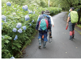
景色を楽しみながら

吉井観光協会は、青や紫に色づくアジサイの咲く牛伏山を巡るハイキングを開催します。牛伏ドリームセンターで昼食や入浴も楽しめます。コースは、アジサイの咲いているゆるやかな車道を歩くコースと、竹林