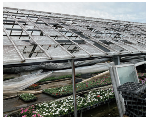
ガラスの割れた農業用ハウス

補助対象となる施設は、修繕にかかる費用の見積額が1施設当たり10万円以上の物です。補助額は、共済制度の加入の有無により異なります。補助を希望する人は、7月27日(水)までに、下記の問い合わせ先に相談してください。