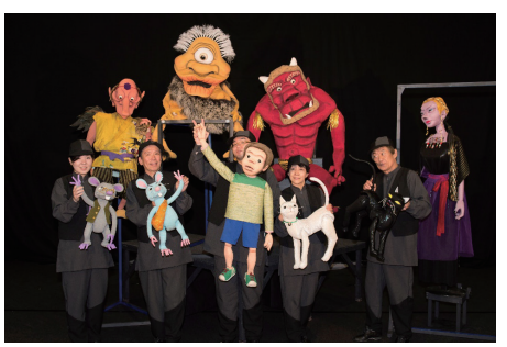
人形劇団むすび座による「かくれ山の冒険」

親子で楽しめるイベントが盛りだくさんです。人形劇と工作教室は、申し込みが必要です。詳しくは、高崎子ども劇場のホームページ(右記)で確認できます。