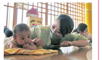
親子の絆を深める

●期日と対象 9月27日(火)=3~6か月児とその保護者 29日(木)=7~10か月児(歩き始める前まで)とその保護者 ●会場=総合福祉センター児童センター ●内容=親子のスキンシップとベビーエクササイズ