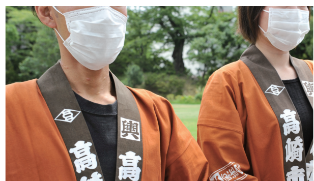
参加団体のマスク着用を徹底

ベストを着た見回り隊が会場内を巡回し、来場者にマスクの着用など感染防止の徹底を呼びかける