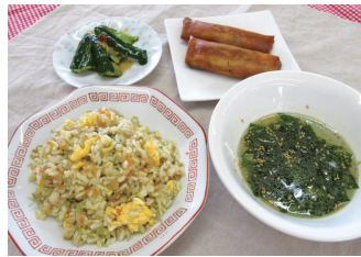
中華料理などにチャレンジ

申し込みは、受付日の午後6時30分から、費用を添えて勤労青少年ホーム(午後1時～9時 ☎323-6732)へ。代理人でも申し込みできます。初めてホームを利用する人は、登録手数料520円と本人確認のできる物がが必要です。