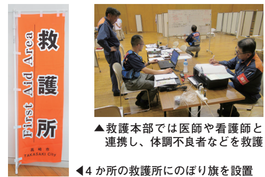
▲救護本部では医師や看護師と連携し、体調不良者などを救護

祭りでは、熱中症対策も強化します。会場全体の暑さを和らげるため、各所で消防団が消火栓からの散水を実施。救急救命士を含む消防局の「まつり救護隊」は、車いすを持って会場内の巡回を行い、体調不良の人を早期に発見・救護します。また、シンフォニーホールに救護本部を設置し、医師や看護師を配置。市役所やシティギャラリーなど7か所に休憩所も設けます。