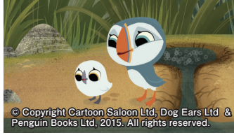
パフィン・ロック

期日 9月16日(金)～22日(木) 会場 シネマテークたかさき 上映作品 パフィン・ロック 入場料 1,100円(3歳～高校生は500円、障害者手帳を持っている人は800円) その他 上映時間や予約方法は、シネマテークたかさきのホームページで確認してください 問い合わせ先 シネマテークたかさき(☎325-1744)