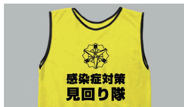
見回り隊が会場を巡回

高崎まつりと山車まつり・大花火大会・技能祭は、新型コロナウイルスの感染拡大防止の対策を徹底して開催します。神輿や山車の出演者などへのPCR検査や、会場を巡回する見回り隊によるマスクの着用や手指消毒の呼びかけなど、全国でも類を見ない対策を実施。各実行委員会と協力し、参加者や来場者の皆さんにとって安心・安全な祭りとなるよう、準備を進めています。