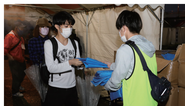
大花火大会では観覧者の密集を防止

観覧者に1.8m四方のビニールシートを配布。シートの中央に座って観覧することで、密集を避ける