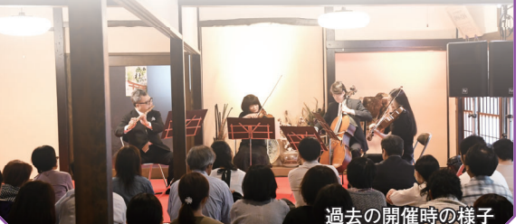
過去の開催時の様子

●期日=9月24日(土) ●時間 1部=午後3時～4時 2部=6時30分～7時30分 ●会場=榛名神社社家町般若坊(榛名山町) ●定員=各部先着50人 ●入場料=3,000円(門前そばの食事付き) ●申し込み=8月19日(金)から、電話で榛名支所産業観光課(☎374-6712)へ