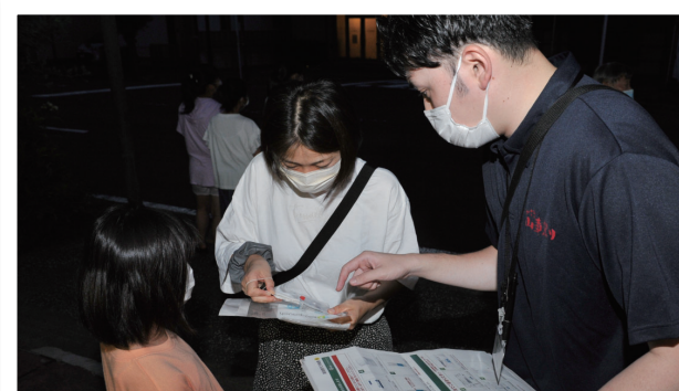
出演者にPCR検査を実施

神輿を担ぐ人と山車のお囃子を演奏する人に、PCR検査を実施。陰性が確認された人だけ参加できる