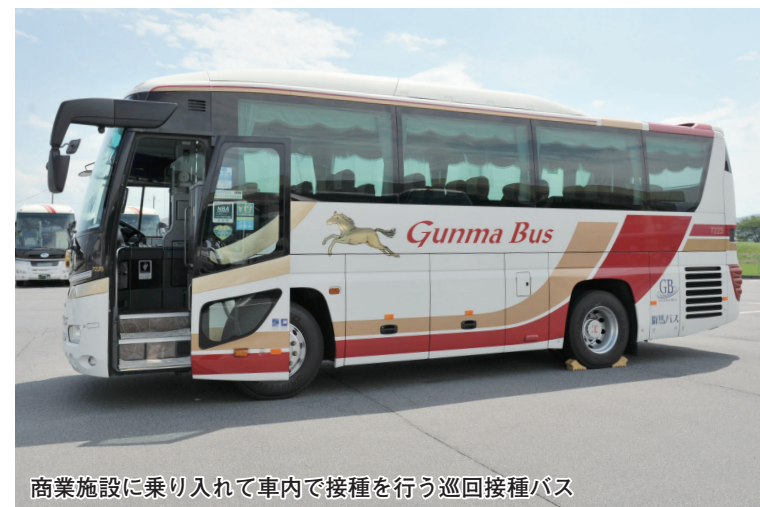
商業施設に乗り入れて車内で接種を行う巡回接種バス

手話通訳が必要な人や障害のある人は、障害者支援SOSセンター・ばるーん（市総合保健センター2階。火～日曜日☎325-0111）で、ワクチン接種に関する相談ができます。ファクス（☎325-0112）などでも受け付けます。