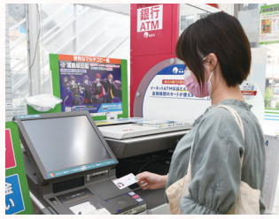
午前6時30分～午後11時にコンビニで住民票などが取れる