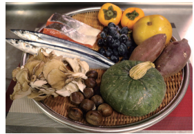
旬の食材は栄養が豊富

「夏より過ごしやすくなってきたけれど、体調が優れない」と感じていませんか。夏から秋へと変わる今の季節は、自律神経が乱れやすく、体調を崩しやすくなります。夏に溜まった疲れや、朝夕と日中との寒暖差、気圧の変化などの影響が考えられます。次のポイントを参考に、体調管理を心がけてください。