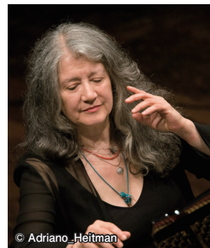
マルタ・アルゲリッチさん

●出演=マルタ・アルゲリッチ(ピアノ)、カルテット・アマービレ(弦楽四重奏)ほか ●曲目=シューマン「ピアノ五重奏曲変ホ長調」ほか ●入場料=S席9,000円、A席7,000円、B席5,000円、25歳以下1,000円(S・A・B席は指定、25歳以下は座席指定不可。未就学児は入場できません) ●チケット インターネット(メンバーズ)=9月16日(金)午前10時発売 電話=17日(土)午前10時から高崎芸術劇場チケットセンター(☎321-3900)で受け付け 窓口=取扱窓口で18日(日)発売 ●問い合わせ先=高崎芸術劇場チケットセンター