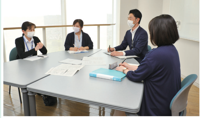
個別のワーキングチームを結成。子ども一人一人に合った支援方法を検討します