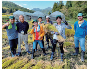
自然の中で英語に親しもう

市は、小中学生が生きた英語を学べる山村留学施設「くらぶち英語村」の来年度の留学生を募集します。募集するのは、1年間を過ごす通年コースです。自然豊かな倉洲地域で、ネイティブスピーカーのスタッフと共に日常生活を送り、地元の小中学校に通学。野菜作りやキャンプ、川遊びなどさまざまな活動を体験しながら、より実践的な英語力を身に付けていきます。