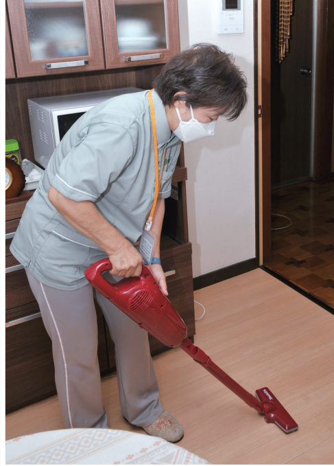
「ヤングケアラーサポーター」が支援を必要とする家庭へ訪問。家事や介護をお手伝いします

本 来は大人が担う家事や家族の世話など、年齢に見合わない過度の負担により、学業や友人関係などへの影響が指摘されるヤングケアラー。今回は、ヤングケアラーのいる家庭を支援するために9月からスタートした「ヤングケアラーSOS」について、実際に支援に携わる皆さんをお招きしてお話を伺います。