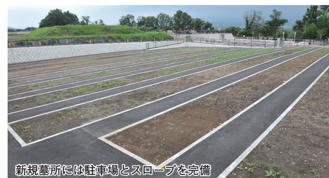
新規墓所には駐車場とスロープを完備