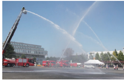
日頃の訓練の成果を披露

市は、高崎市等広域消防局や市消防団、市女性防火クラブなど約350人による総合防災訓練を実施します。