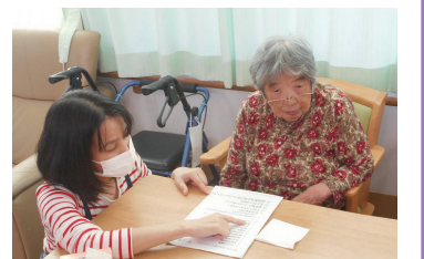
2日間は介護現場で実習

市は、介護職を目指す人向けに、介護の基本的な知識や技術などを身に付ける研修を開催します。介護施設などで実習も実施。時間は期日によって異なります。詳しくは、市ホームページで確認してください。