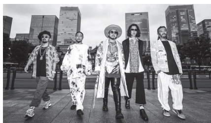
SOIL & "PIMP" SESSIONS