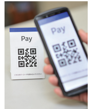
2次元コードを読み取って支払い

順次ポスターなどを発送します。ポスターは、入り口など店舗の外から目立つ所に掲示してください。