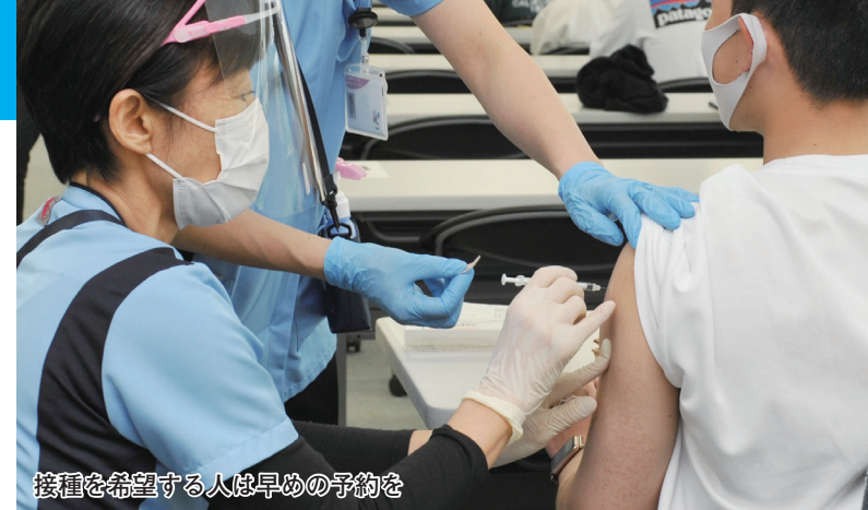
接種を希望する人は早めの予約を

市は、新型コロナウイルスの1~4回目のワクチン接種を行っています。対象者は次のとおりです。