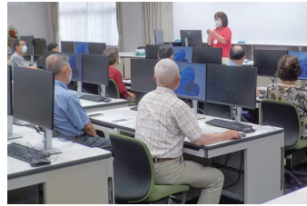
とっておきの写真を年賀状に

初心者を対象に、スマートフォンの写真の活用について学ぶ教室を開催します。スマートフォンで撮った写真をパソコンに取り込み、年賀状を作ります。