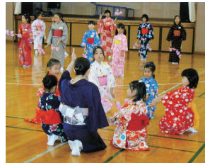
基本の所作から楽しく体験

●日時=11月12日～12月10日の日曜日、午前10時～正午、計5回 ●会場=中央公民館 ●内容=日本舞踊を1曲踊れるようにする ●対象=市内に在住か、在勤の小学生で5日間とも参加できる人 ●定員=20人(抽選) ●締め切り日=10月27日(金)