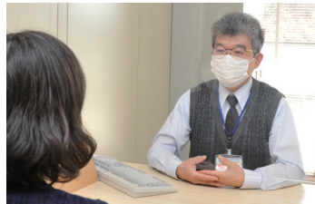
まずは気軽に相談を

市は、市総合保健センター2階障害者支援SOSセンター・ばるーんで、第2・4水曜日にハローワーク高崎の職員による就労相談を行っています。