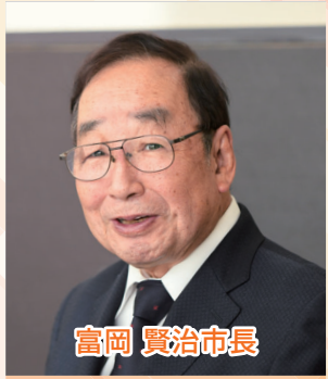
富岡 賢治市長 チャレンジする若者を応援するため、若者が働きやすいまちづくりに取り組む