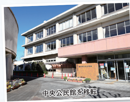
中央公民館を移転