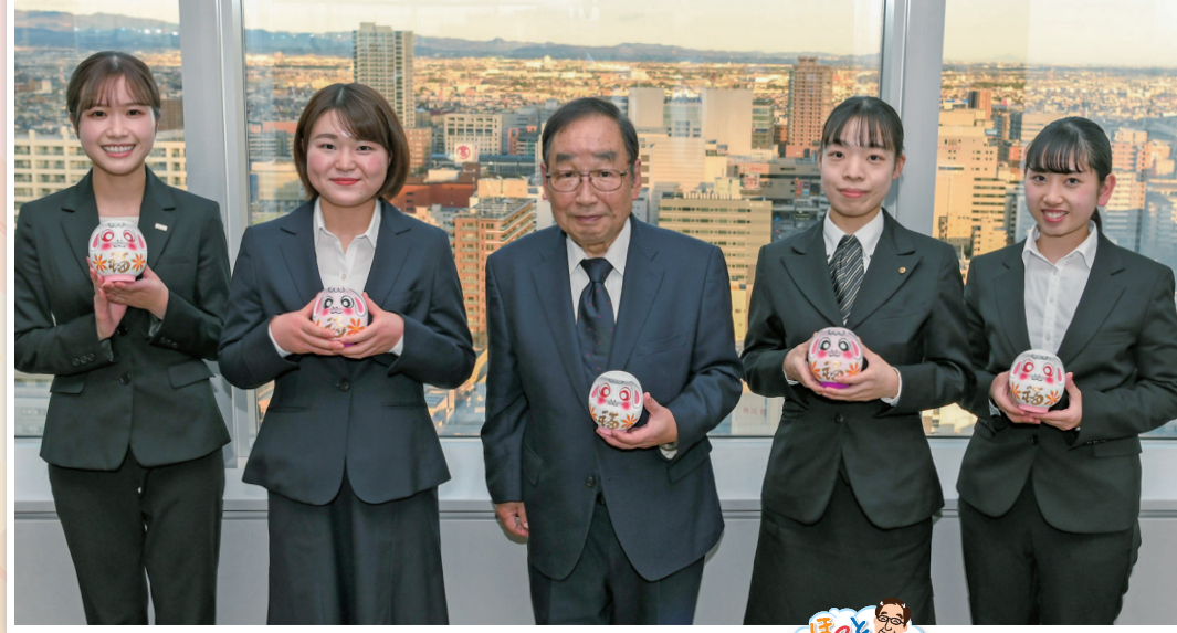
ほっとTタイム 新春市長対談