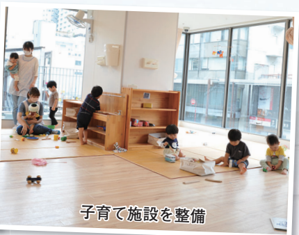
子育て施設を整備

図書館、遊び場などの子育て施設も設置します。他にも会議室や展示スペースを備え、新しい市民活動の拠点となることを目指します。また、現在問屋町にある高崎商工会議所もビル内へ移ります。8～27階は、マンションとして住居約290戸を整備予定です。