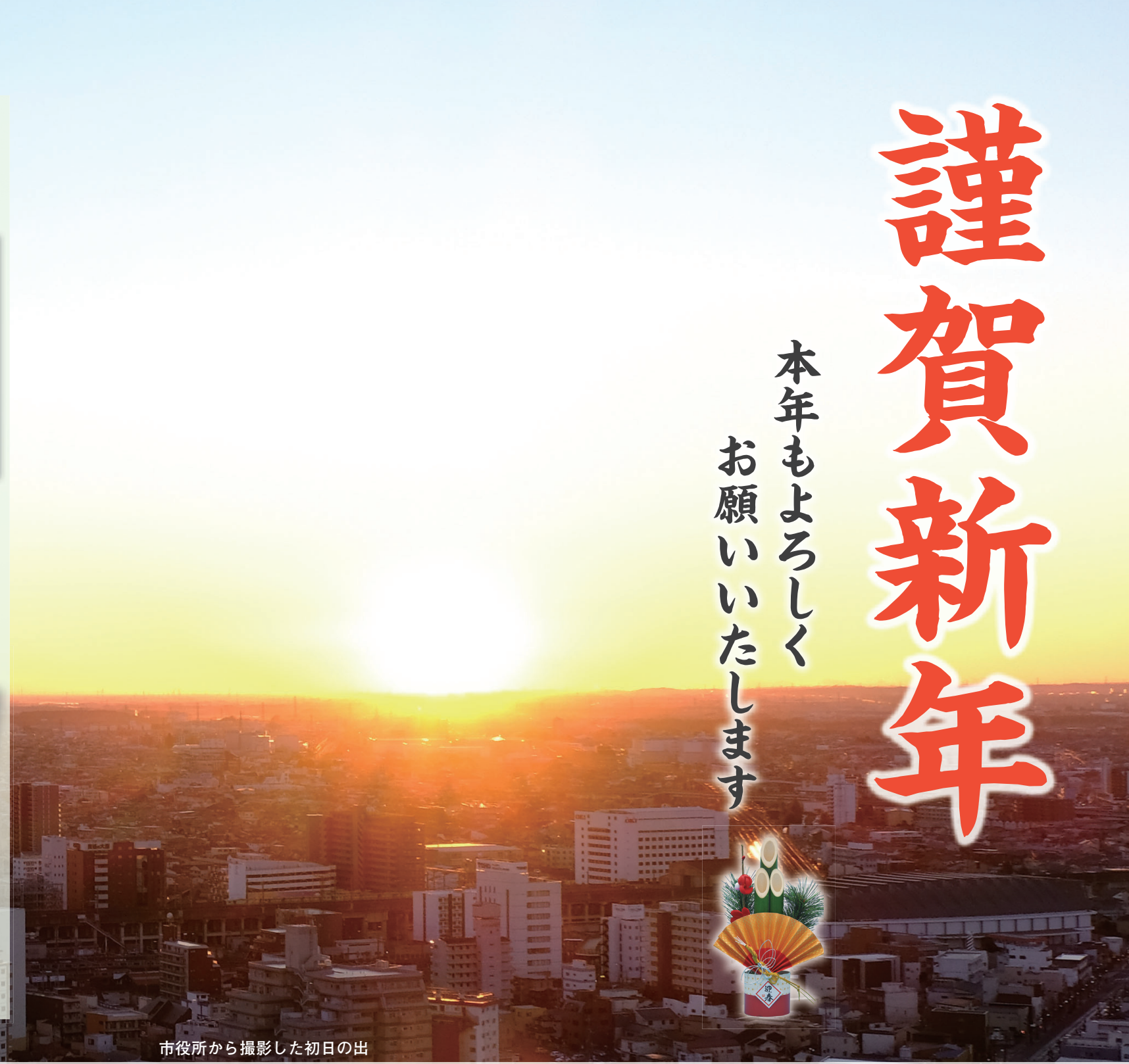
市役所から撮影した初日の出