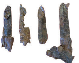
片山遺跡1号古墳出土短剣形鉄製品

吉井郷土資料館は、吉井町の穂積地区に焦点を当てた企画展を開催します。同地区の片山遺跡群から出土した副葬品や穂積神社に伝わる宝刀、養蚕御札など、古代から近現代までの資料約60点を展示。同地区の歴史を紹介します。