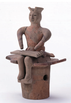
椅子に座る男子埴輪

かみつけの里博物館は、 埴輪について深く知るため の企画展「わくわく!はに わ体験'23」を開催します。 埴輪の歴史や種類、作られ た理由などを紹介。円筒埴 輪をはじめ、人や馬、家な どさまざまな形の埴輪や、 埴輪のルーツと考えられて いる穴の開いた土器なども 展示します。知っているようで意外と知らない、埴 輪の秘密に迫ります。