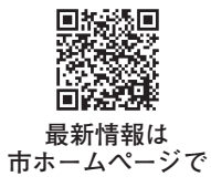
最新情報は市ホームページで

接種を受けられる期間が延長となり、4月末まで下記のとおり接種を実施します。4月中に接種を受けられるよう、希望する人は早めに予約してください。5月以降の接種については、決まり次第、市ホームページや広報高崎などでお知らせします。