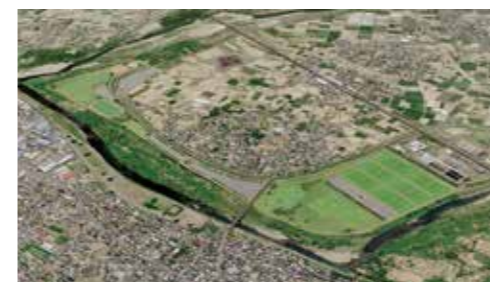
さまざまなスポーツが楽しめる施設を高崎市民ゴルフ場跡地に整備