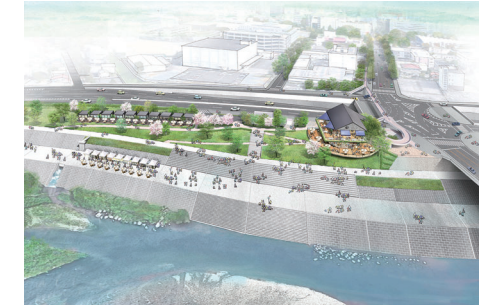
烏川のほとりを整備（イメージ）

中心市街地から烏川への回遊性を高め、高崎産フルーツなど農産物のブランド化を図るため、主に榛名地域の果物を提供するフルーツカフェを新たに整備します。