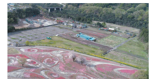
防災拠点機能を備えた運動場を整備