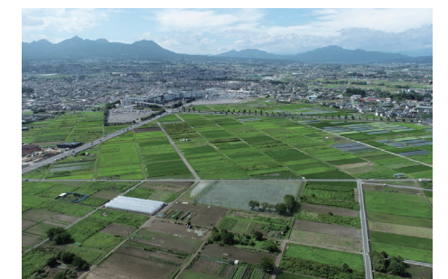
堤ヶ岡飛行場跡地の活用に向けた調査を実施