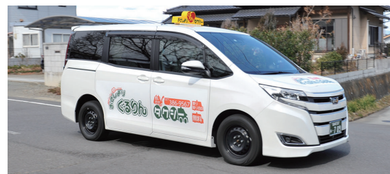
無料で利用できるおとしよりぐるりんタクシー

【拡充】高齢者の日常生活の移動手段を確保 おとしよりぐるりんタクシーの運行 ..... 2億6,013万円