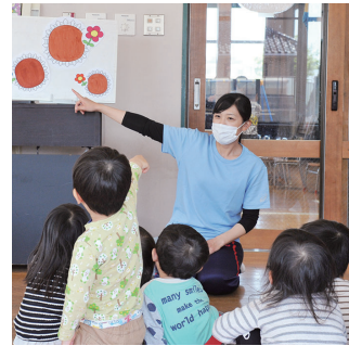
保育人材の定着を促進