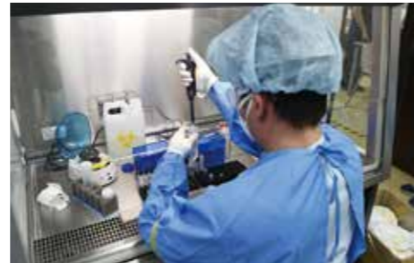
病原体検査を支援