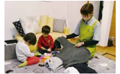
サポーターが自宅に伺い支援を実施

家事やきょうだいの世話、家族の介護などをする中・高校生の負担軽減を図るため、家事や介護などにかかわる支援を行います。