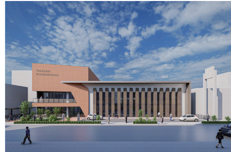
新しい労使会館（イメージ）