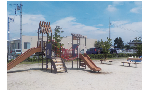
まちなかの公園を計画的に美化

身近な小規模公園の美化に向け、公園愛護報償金の拡充、清掃や除草、樹木診断、トイレ改修を5か年計画で継続して取り組みます。