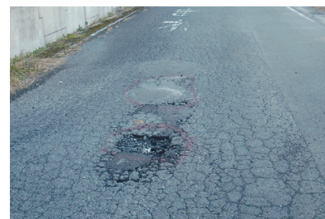
穴ぼこなどを改修し安全な道路環境に