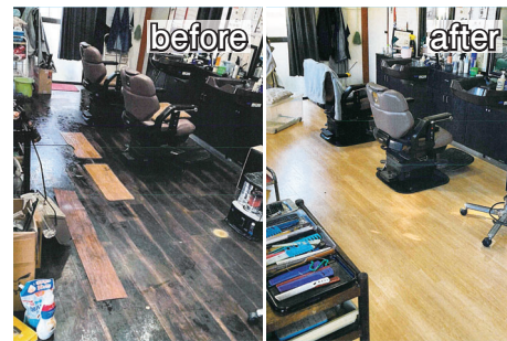
リニューアル助成を利用して床の修繕を行った理容室

ホールや会議室などの現在の機能に加え、市内で働く人や近隣住民が利用できる体育館を併設します。今年度は、現在の施設を解体し、建設工事などに着手します。