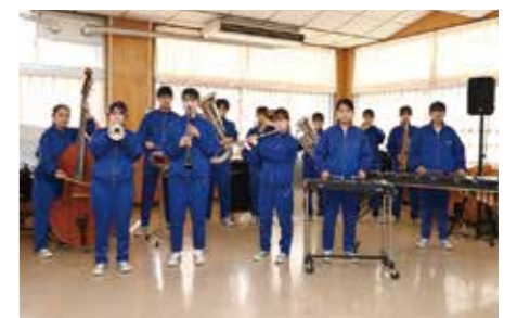
学校の楽器の補充や音楽活動を支援