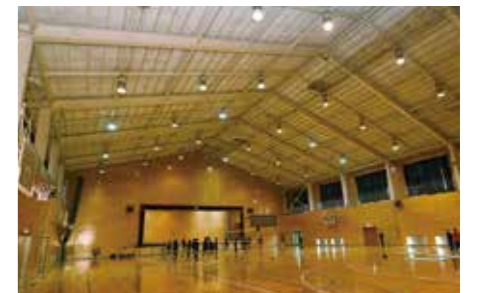
体育館照明のLED化など学校環境を改善

学校環境の改善を図るため、トイレの洋式化や外壁改修などに引き続き取り組みます。また、今年度から新たに、体育館照明のLED化を進めます。