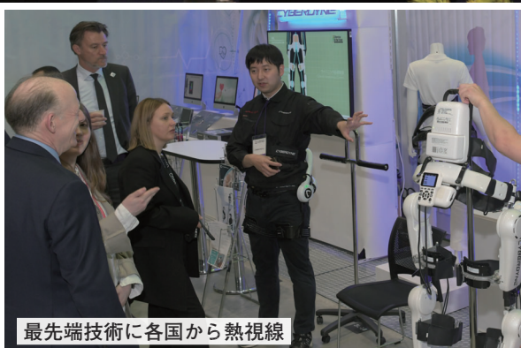
最先端技術に各国から熱視線