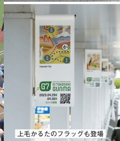
上毛かるたのフラッグも登場