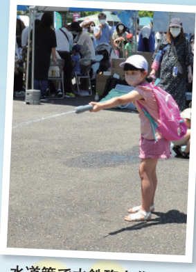
水道管で水鉄砲を作ろう