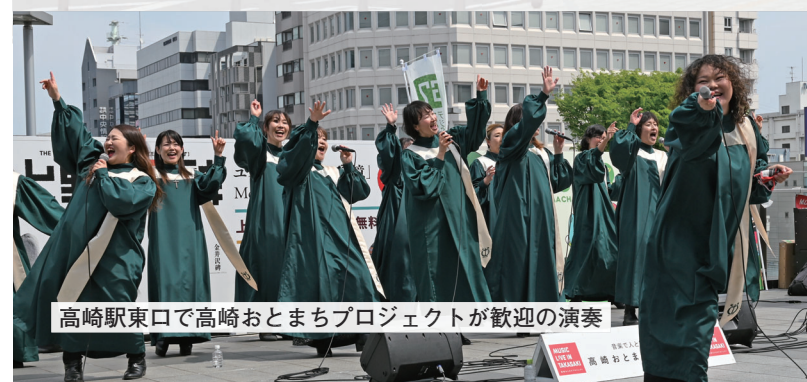
高崎駅東口で高崎おとまちプロジェクトが歓迎の演奏