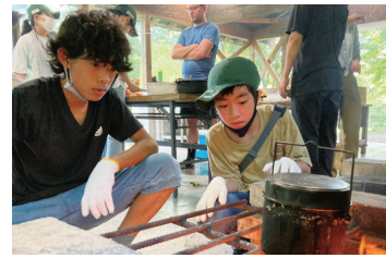
自然体験も楽しみながら

小中学生が生きた英語を学べる山村留学施設「くらぶち英語村」の留学生を募集します。募集するのは、夏休みに行く短期コースです。自然豊かな倉洲地域で、ネイティブスピーカーのスタッフと、山歩きや川遊びなどさまざまな体験をしながら、実践的な英語力を身に付けます。