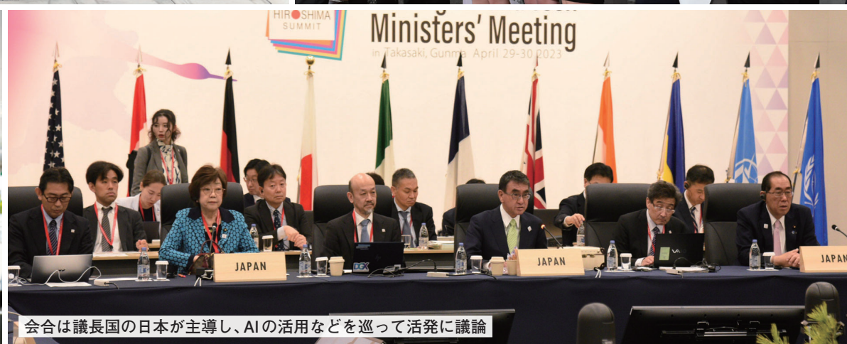
会合は議長国の日本が主導し、AIの活用などを巡って活発に議論