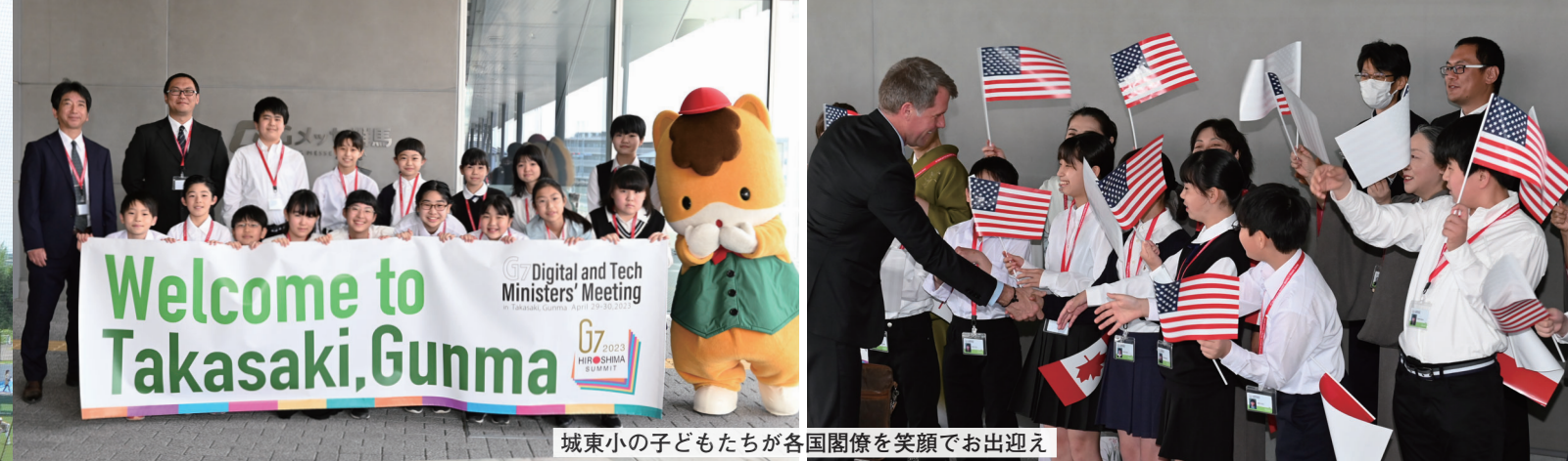
城東小の子どもたちが各国閣僚を笑顔でお出迎え