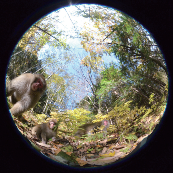
〈ニホンザル〉2020年 作家蔵

●期日 ①藍染=6月4日(日) ②草木染=6月11日(日)・21日(火) ●時間=午前10時～正午 ●内容=1人1点の染色体験 ●定員=各回先着15人 ●費用=①ハンカチ600円、バングナ1,000円 ②ポケットチーフ600円、スカーフ1,200円 ●申し込み=開催日の3日前までに、電話で染料植物園へ