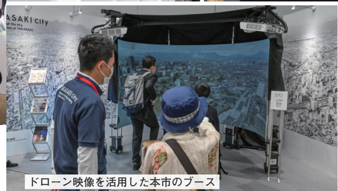
ドローン映像を活用した本市のブース