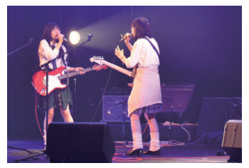
青春の1ページを仲間とともに

高校生バンドフェスに参加してみませんか 8月12日(土)・13日(日)に新町文化ホールで開催する「高校生バンドフェスティバル」の出演者を募集します。 ●対象=高校生のアマチュアバンド ●申し込み=6月6日(火)までに、市ホームページ(下記)から申込書をダウンロードして記入し、オリジナル曲(コピー曲も可)1曲を録音したCDと、メンバー全員が写った写真1枚を同封し、〒370-1301 新町3190-1 新町文化ホール(☎0274-42-9133)へ