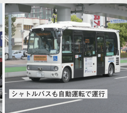
シャトルバスも自動運転で運行