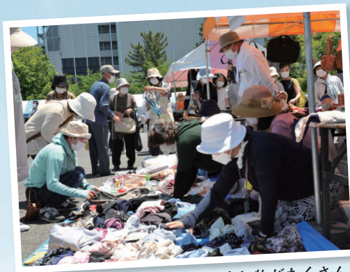
フリーマーケットには掘り出し物がたくさん