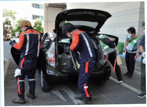
ドライブスルーで小型家電などを回収

フリーマーケットには掘り出し物がたくさん 水道管で水鉄砲を作ろう ドライブスルーで小型家電などを回収