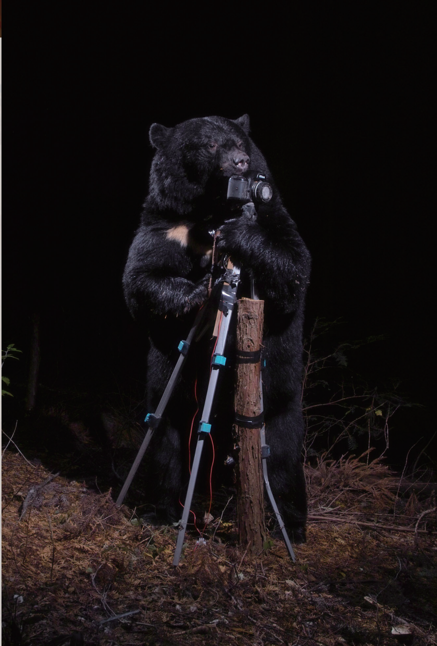
〈ツキノワグマのカメラマン〉2006年 作家蔵