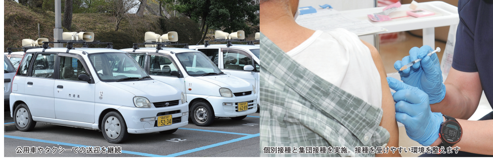
公用車やタクシーでの送迎を継続