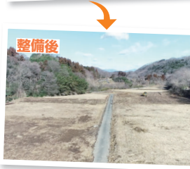
重機を入れて木の伐採から整地までを行った農地