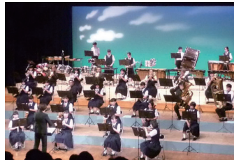
子どもから大人まで楽しめる