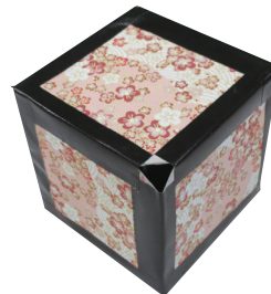
神秘的な世界が広がる

●期日=6月10日(土) ●会場=創作室 ●内容=鏡に好きな模様を付けて、のぞくと光って見える万華鏡を作る ●対象=市内に在住か在学の小・中学生(小学3年生以下は保護者同伴) ●定員=12人 ●費用=300円 ●締め切り日=5月25日(木) ●期日=6月1日(木) ●会場=パソコン