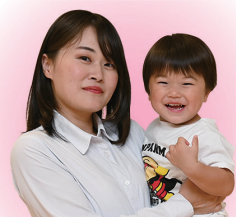
利用者に聞きました

着替えだけあれば良いので利用しやすいです。スタッフがしっかり見守ってくれて、安心して預けられますね。いろんな世代のお友達がいるので、子どもも楽しいみたいで。おしゃべりも上手になったんですよ