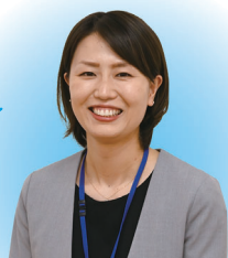
相談員に聞きました

保育士として働きたい人、復職したいけど何から始めたら良いかわからない人など、まずは一度ご相談ください。学生さんは学校以外の相談場所として、保育士さんは職場以外の相談場所として、悩みや不安があれば気軽に利用してくださいね