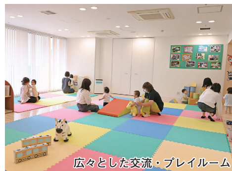
広々とした交流・プレイルーム