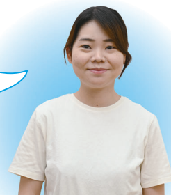
利用者に聞きました

補助があることで生活にゆとりができてとても助かっています。子どもたちを笑顔にできる保育士を目指して頑張っています