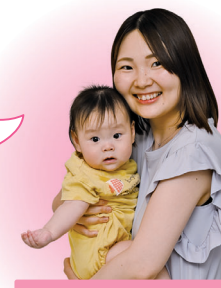
利用者に聞きました

調理などをやってもらっている間に、子どもの世話や他の家事ができるので本当に助かります。ヘルパーさんとお話するのも楽しくて、気分転換になっています