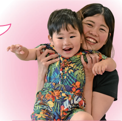
利用者に聞きました

おもちゃで遊んだりイベントに参加したり、子どもも私も楽しんでいます。良い気分転換になりますよ。室内で遊べる施設があるのはうれしいですね