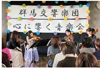
プロの演奏を間近で楽しむ

群馬交響楽団は、団員による無料の出張コンサート「心に響く音楽会」を開催する団体を募集します。