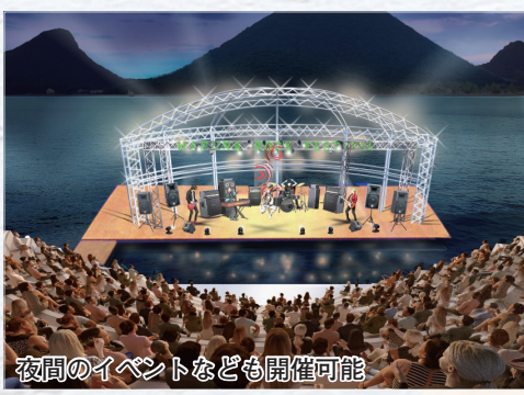
夜間のイベントなども開催可能

今後は、議会の予算審議を経て、令和6年度に調査・設計を行い、令和7年度に工事に着手。榛名湖畔の新たな観光資源として、令和7年度末の完成を目指します。