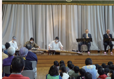
和の音色を身近に楽しむ

和の響きこだま音楽会は、市内で活動する箏・尺八・三絃(三味線)など和楽器の演奏団体が市民の皆さんのところへ出張して演奏する無料の演奏会です。市は、この音楽会を開催する個人や団体を募集します。