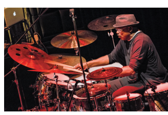
ハービー・メイソンさん

●出演=ハービー・メイソン(ドラム)、フェリックス・パストリアス(ベース)、マーク・ド・クライブ・ロウ(キーボード)ほか ●入場料=6,000円、25歳以下2,500円(全席指定、未就学児は入場できません) ●チケット=インターネット(メンバーズ)と高崎芸術劇場チケットセンター(☎027-321-3900)、取扱窓口で販売中 ●問い合わせ先=高崎芸術劇場チケットセンター