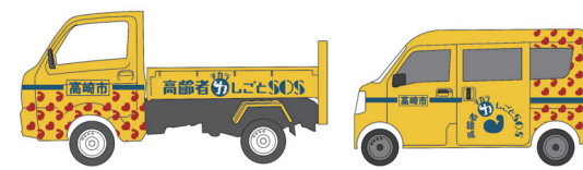
専用車両で伺います